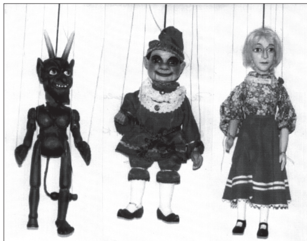
110 / Volné sdružení Kašpárek: Restaurované loutky Čert, Kašpar, Manka, 1933.

INFORMACE pro MČAD zprac. Marie Vráblíková. Rkp. 1998. 1 s. kART.