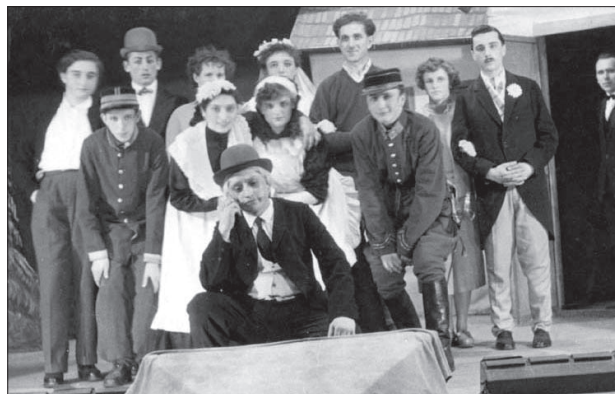
122 / ČEPERKA: Jiří Voskovec, Jan Werich: Slaměný klobouk - jedno z posledních vystoupení ochotnického souboru Tyl.

V 1. pol. 20. let 20. stol. DO Sokola , 1923 členem ÚMDOČ, též SDH , 1924 členem ÚMDOČ.