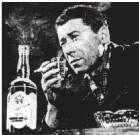
442 / Hanácká scéna: Z inscenace hry Roberta Thomase Past, 1963.