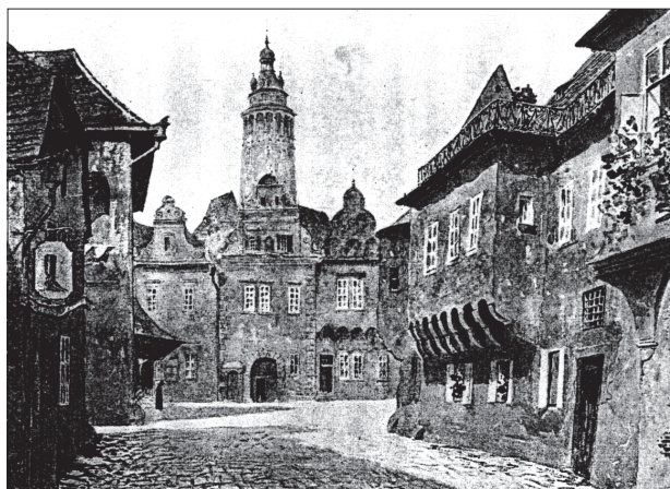
468 / Návrh prospektu náměstí od Václava Jansy.

INFORMACE pro MČAD zprac. Alice Dubská. Rkp. 2000. PC ART. ČČAD, s. 99; DČD III , s. 194.