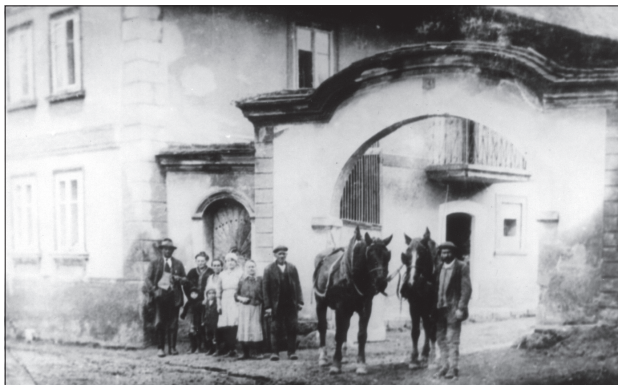
540 / LIDICE: Smutný obrázek z nacisty likvidované obce: Hospoda U Šilhánů, v níž se hrávalo ochotnické divadlo

INFORMACE pro MČAD: Místopis okresu zprac. Lubor Dobner, Mojslava Sehnalová, Miroslav Oliverius, St. Krajník. Rkp. 1998-2000. kART.