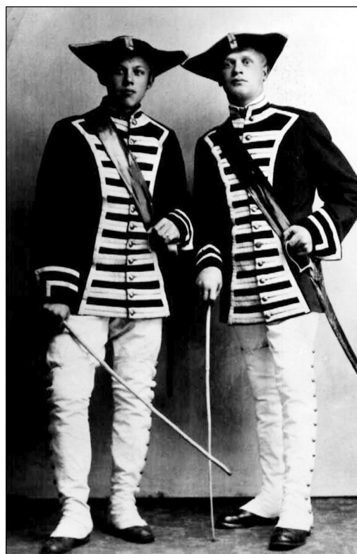
30 / Biřici z Mahenova Jánošíka.