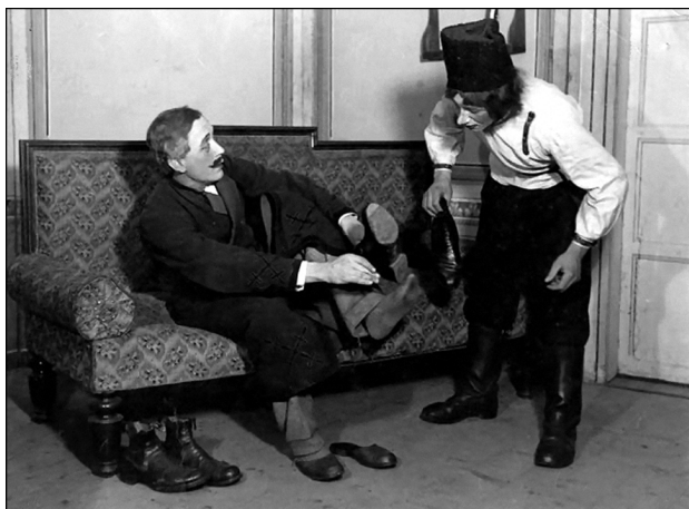
96 / Dramatický odbor Občanské besedy uvedl v roce 1948 Gogolovu Ženitbu .