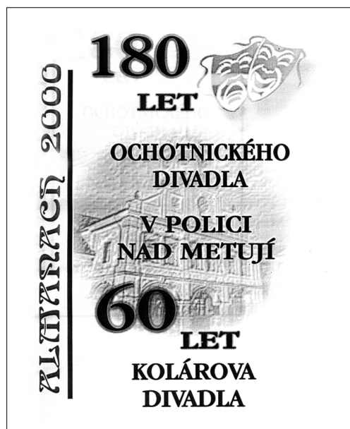
206 / Publikace zachycující přínos ochotnického divadla kultuře obcí a měst jsou svědectvím o jeho nezanedbatelném významu.