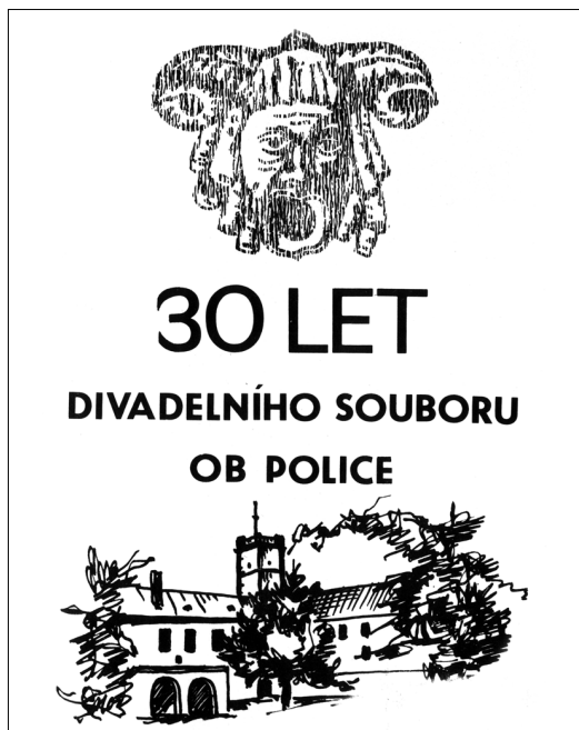
205 / Obálka publikace vydané k výročí 30 let divadelního souboru Osvětové besedy, 1986.