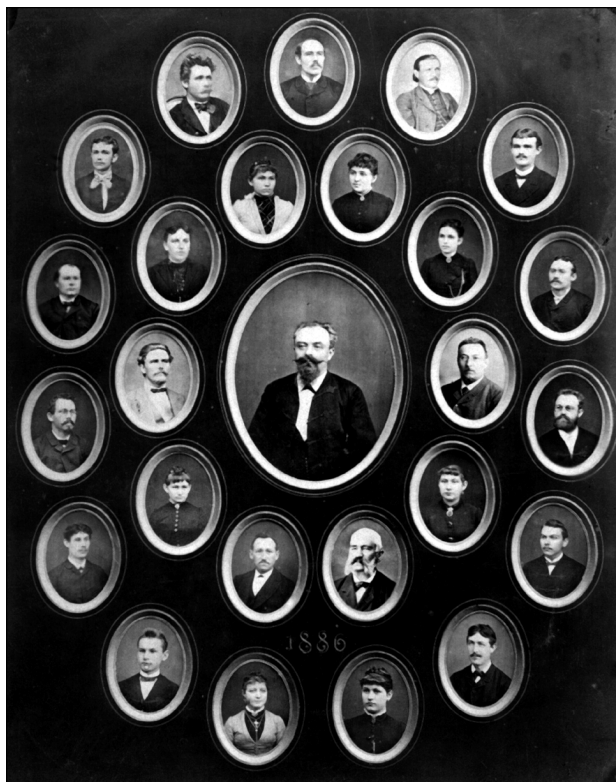
222 / Tablo členů Spolku divadelních ochotníků, 1886.