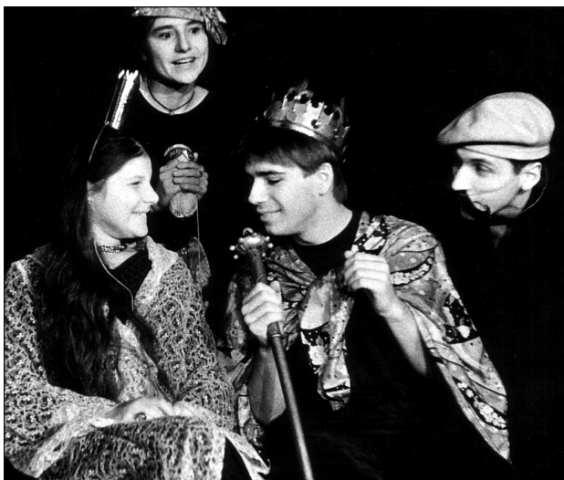
393 / Na Stodůleckém písečku 1999 hrála skupina Bez názvu holešovického Ty-já-tru Pohádky z košíku.

podnět k zal. DrO 1908. Repertoár český, Šubert, Pešková, Svoboda, Jirásek, Tyl. 1922 členem ÚMDOČ. 1927 zal. Ochotnická beseda Mošna. DrO FDTJ 1930 členem X. obvodu Pražského kraje SDDOČ. Od 1936 DS Havlíček , Stodůlky-osada Háj, působil i za 2. svět. v. (jako Pěvecko-dramatický spolek). 1937 DS Jirásek . 1938 Pěvecký a dramatický spolek , 1940 Ryba a host třetí den smrdí. 1959 RS osmiletky literárně-hudební pořad A pro tu lásku se všemi nadějemi.