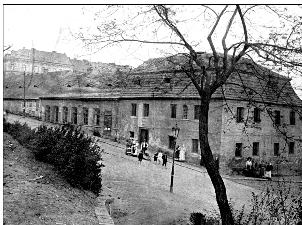
420 / Budova restaurace Na Kovárně. Působíště ČOB Bozděch v letech 1895-1910.