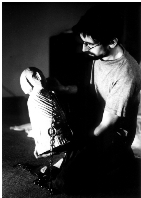
419 / Inscenace Uváznutí souboru Běžná hlava vycházela z motivů knihy J. Wassermanna Kryštof Kolumbus - Don Quijote oceánu. 1997.