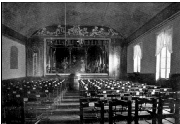
421 / Divadelní sál v restauraci Na Kovárně s jevištěm.

Od 1945 Bozděch, div. a společenský klub Vršovice, později pod OKD Praha 10. Hrál nejprve v hostinci U Vandů, do 1912 pak postupně v hostincích U města Mexika, U vlasti, Na kovárně, v hotelu Servus, v Bartošově hostinci, pak v sokolovně, v Lidovém domě, v Nd na Vinohradech. 1946-1962 nejplodnější období souboru, 1957 např. Obyčejný člověk (Leonov), Čestmír (Tyl), 1959 Člověk ze starých novin (Hikmet), r. N. Ropek,