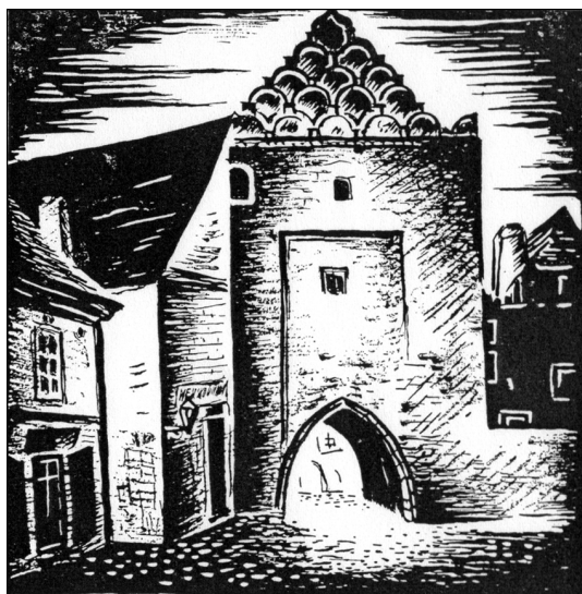
689 / Staré tábořské divadlo.

1680 v kostele teatralizované pašijové pobožnosti. 1681 velkonoční hra. 1683 patrně Komédie o turecký vojné (pravděpodobnější hypotéza, kladoucí s odkazem na posvěcení v Měsících toto představení do Brandýsa n. L.). 1690 v radničním paláci Zrcadlo masopustu.