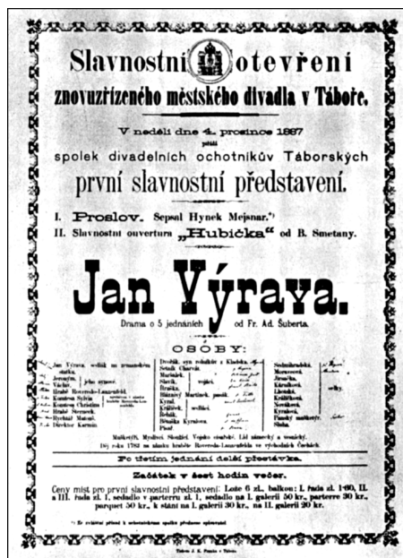
693 / Plakát na slavnostní představení k znovuzřízení městského divadla, 1887.