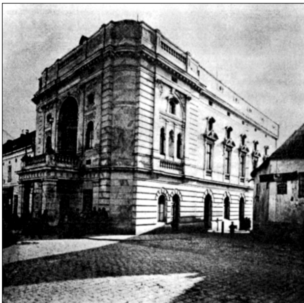
692 / Nové divadlo v roce 1887.

Po 1918 h. ve 20.-30. letech v sálech Přebořovky, Na Mýtě a v Masarykově domě Vzdělávací a dramatický spolek Máj , Dělnická akademie , Proletkult , Jednota čs. Orla , odbočky Strany národně sociální , Církve československé , Církve pravoslavné , Pětašedesátníků , Učňovské besídky , Akademický spolek Štítiny . 1921 zal. Intimní scéna , pravidelně h. ve 20.-50. letech v kině Invalidů, 1938 členem ÚMDOČ, 34 členů, vlastní jeviště, 5 představení (1965 se sloučila s Tylem). 1927 zal. Scéna pracujících , DrO při skupině veřejných zaměstnanců. 1923 zal. Šmahův okrsek ÚMDOČ, sdružující 120 OS. 1930 sídlo kraje SDDOČ.