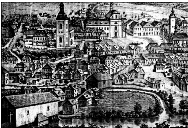
736 / Turnov na konci 18. století.