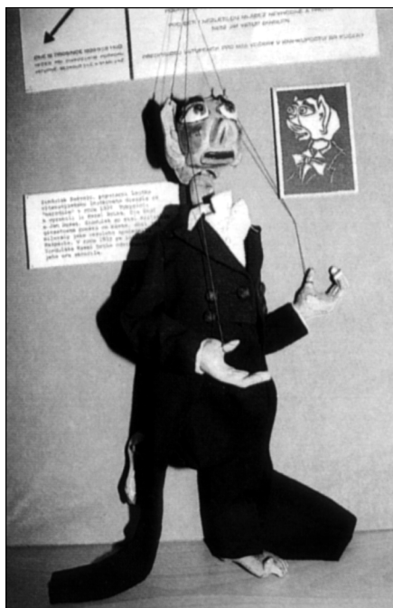
747 / Loutka Zinduláka Pošvejce, který kriticky a humorně glosoval události ve městě, 1927, návrh Ota Rödl.

VALENTA, Jiří: Nejen divadelní prkna znamenají svět. AS 1995, č. 1, s. 13.