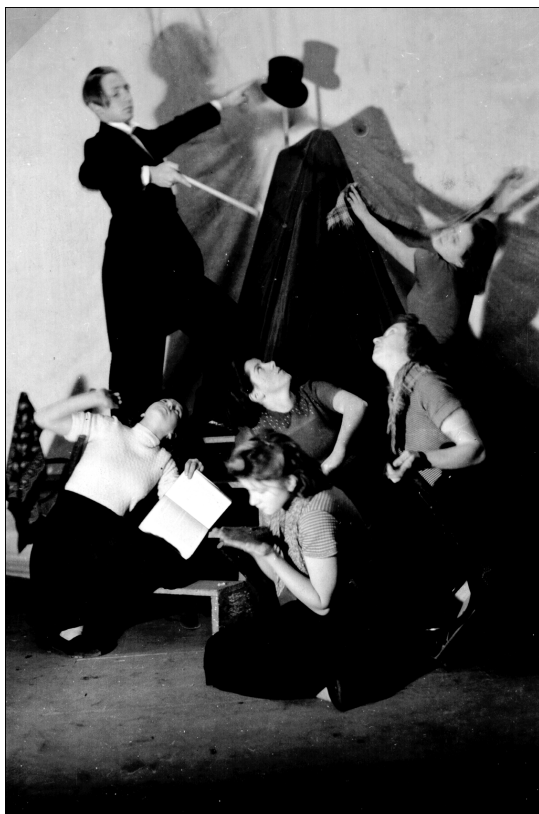
804 / Mladá scéna, K. Havlíček Borovský: Král Lávro, režie Alfréd Radok, 1940.