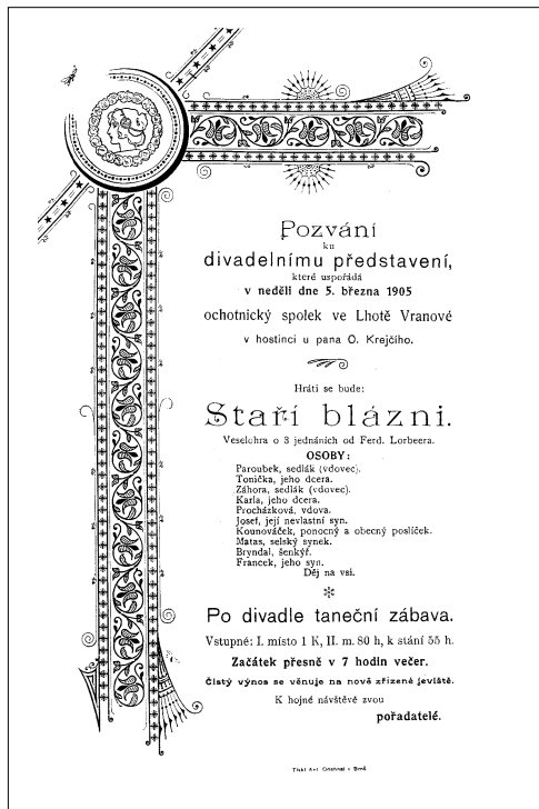
859 / Pozvání na představení Stáří bláznů , 1905.

DO Orla , hrál na vlastním jevišti na Zámečku. Za 2. svět. v. Sokol 1940 Hanácká krev , 1941 Z českých mlýnů (není jasné, zda byla hra uvedena), poté zákaz činnosti.