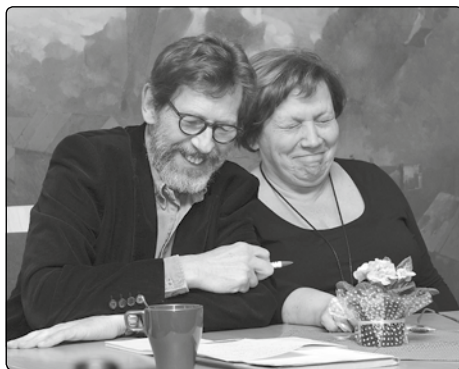
I na psychicky náročném hodnocení představení se najde chvilka uvolnění napětí...

Má mapa zřejmě málo. Práce marná. Hledač trotl. AO zklamán. Mapa nová-obtížnost trotl.