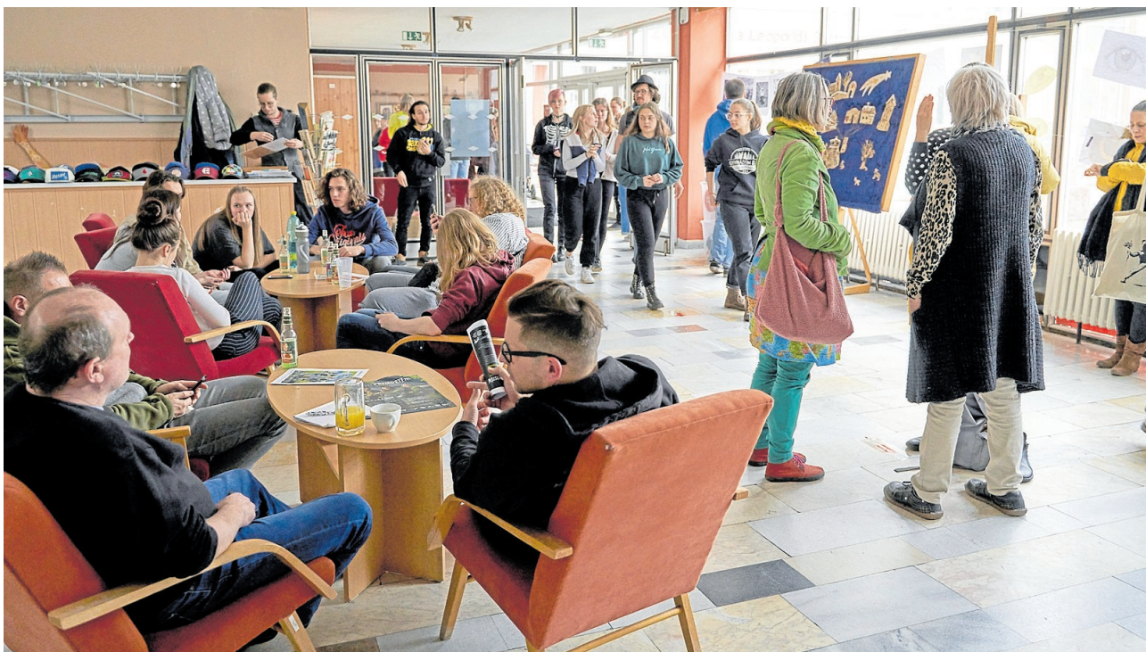
V předsálí se nejen ochutnávají drinky, ale hlavně debatuje, rozmlouvá a potkává.