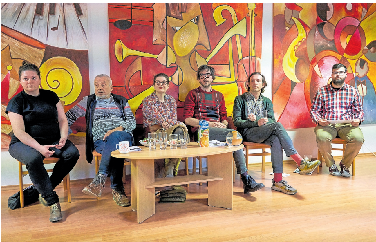
Vyhlížení lektorského sboru. Tam odsud asi přijde inspirace, soubor, názor.