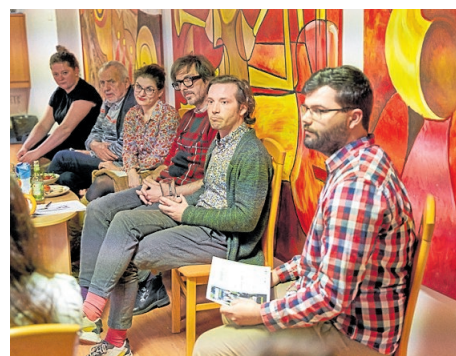
Nebo, že by přišel odsud?