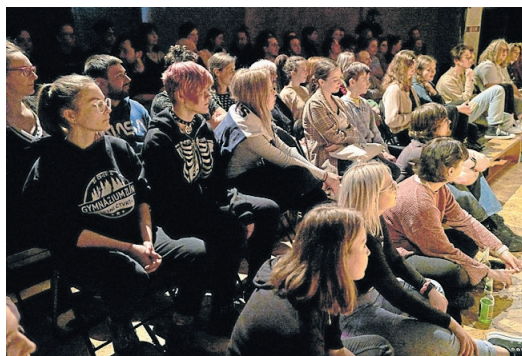
Plno. Na nedostatek diváků si přehlídka nemůže stěžovat.