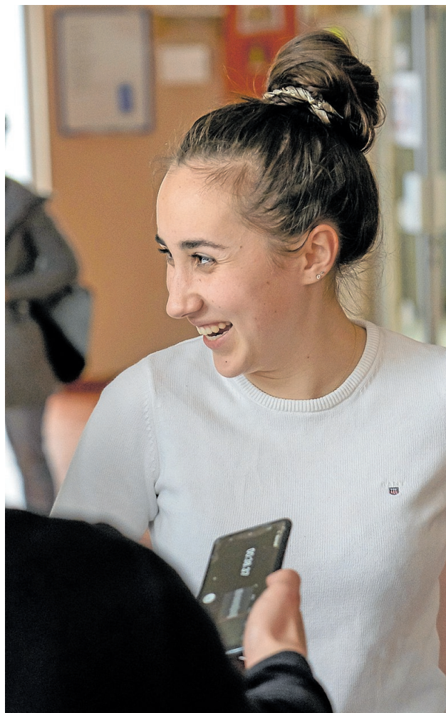
Jsou všude a nikde. Redaktoři Zpravodaje.