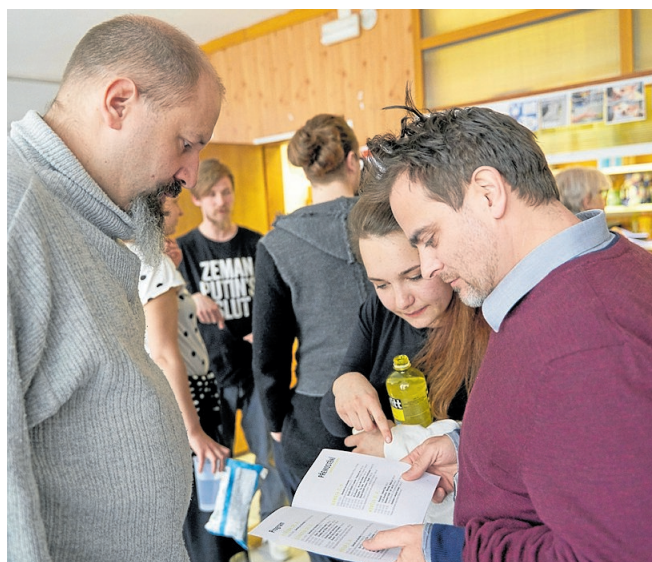
A tady, tady hrajeme my!