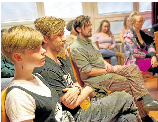
Pro zaslouženou odměnu.

To není lekce gymnastiky, to je seminář Hlas