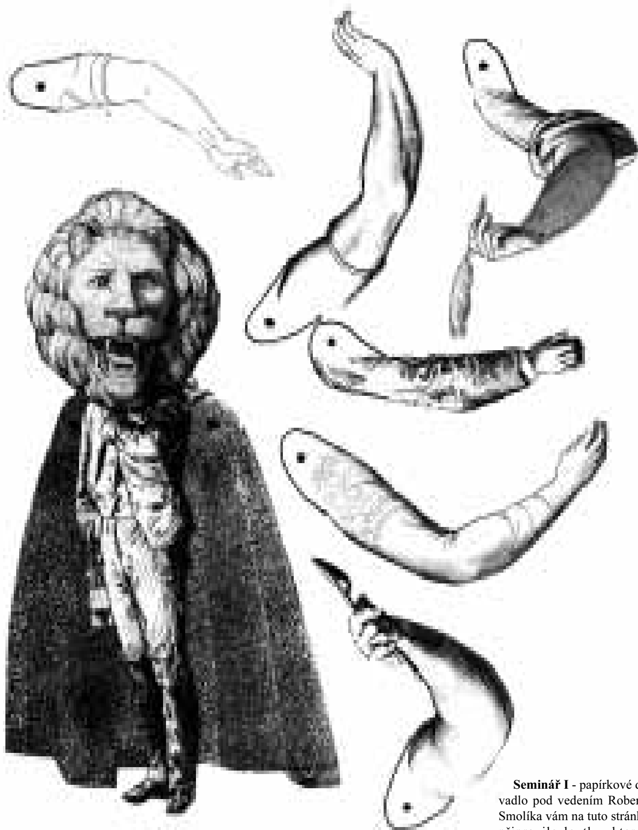
Man Krištofian Pignoni

Seminář I - papírkové divadlo pod vedením Roberta Smolíka vám na tuto stránku připravilo loutku, kterou si můžete okopírovat na kartón a poté použít.