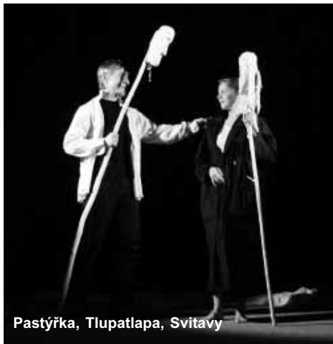
Pastýřka, Tlupatlapa, Svitavy