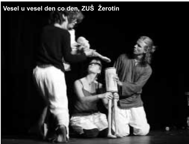
Vesel u vesel den co den, ZUŠ Žerotín