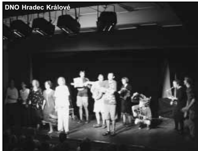
DNO Hradec Králové