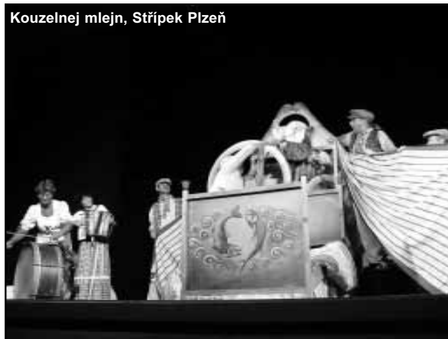
Kouzelné mlejno, Střípek Plzeň