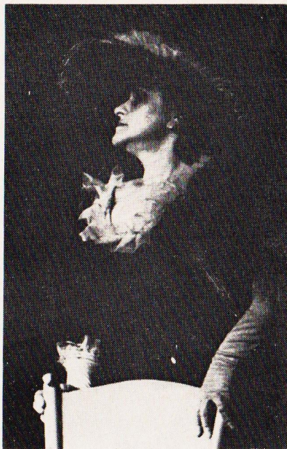
M. Gorkij „Falešná mince“. Amatérská scéna KKP Rožnov pod Radh. (1973).