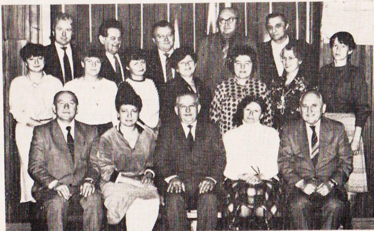
Organizační štáb se zástupci patronů v roce 1986.