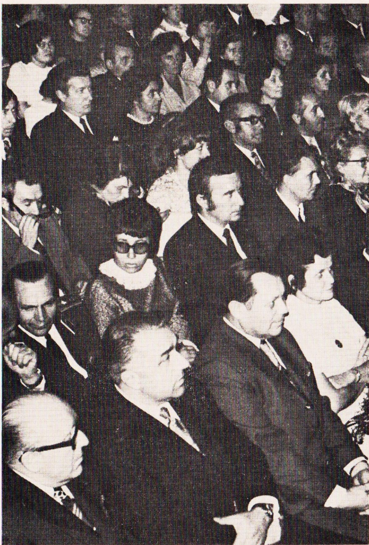
Pozorní diváci představení.