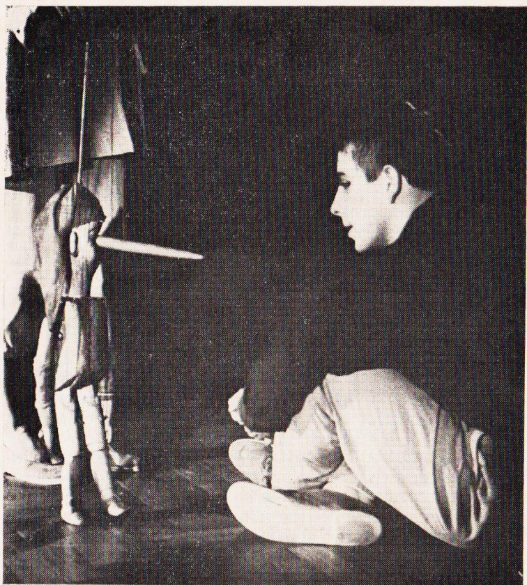
Sál Městského dvora Doprapo Praha - Pinokijo.