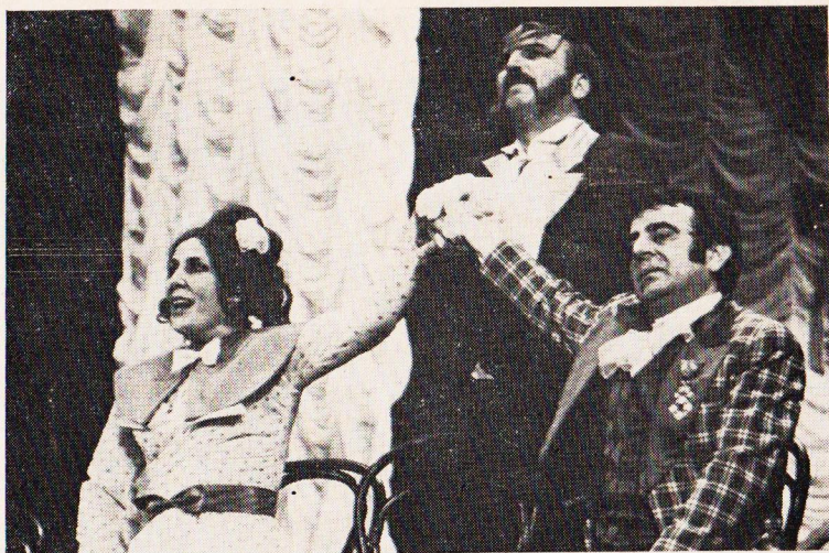
Satirické divadlo Všeodborového domu kultury Burgas (BLR) N. V. Gogol - Ženitba (1973).