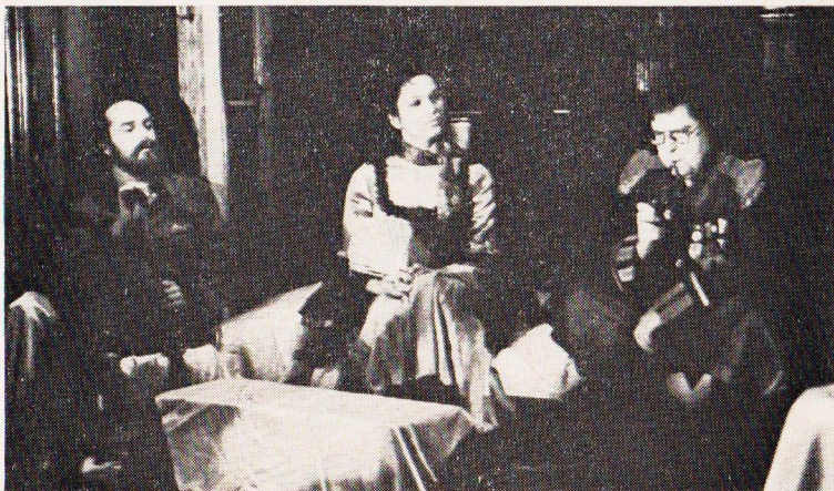
Sál OKS Divadlo pro 111 České Budějovice - Ať žije Paříž.

Pro zvláštní požadavky souborů jsou ve Svitavách k dispozici další prostory.