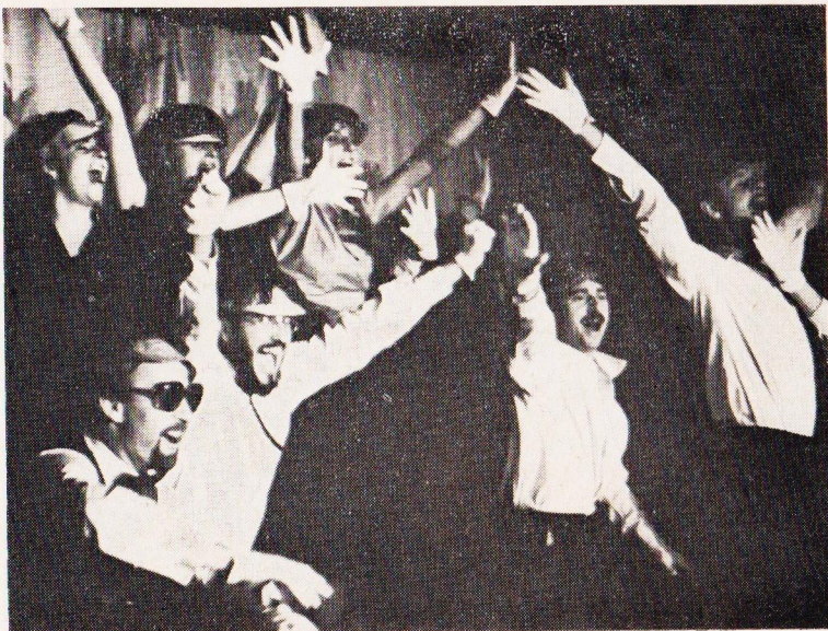
Malý sál Domu odborů Divadlo Cylindr Brno III - Trust.