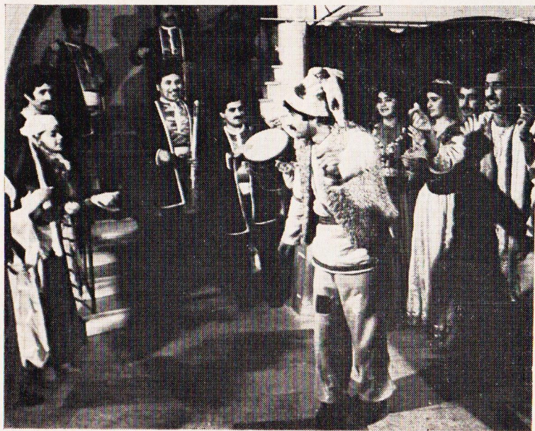
Lidové divadlo Domu kultury Nizami obce Mardakjany - Baku, Azerbajdžánská SSR - E. Bachyšem - Melikmamed (1985).

Zahraniční účastníci přehlídky jsou vždy vítanými hosty.