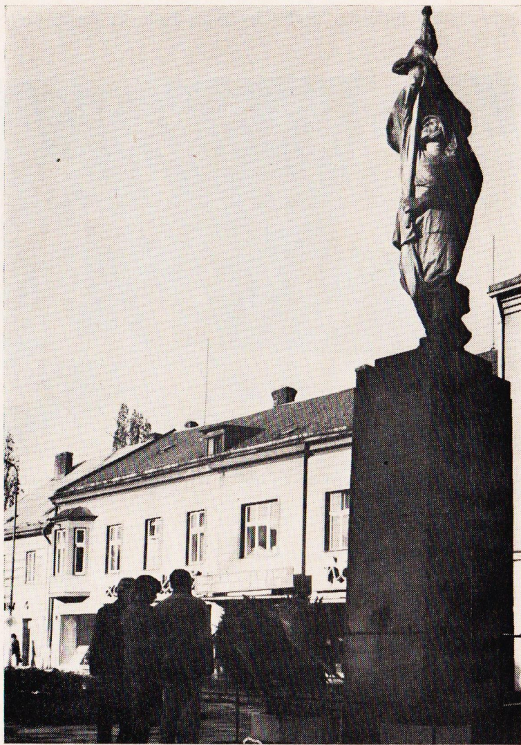
Všechny soubory vzdávají hold osvoboditelům kladením věnců u Památníku osvobození.