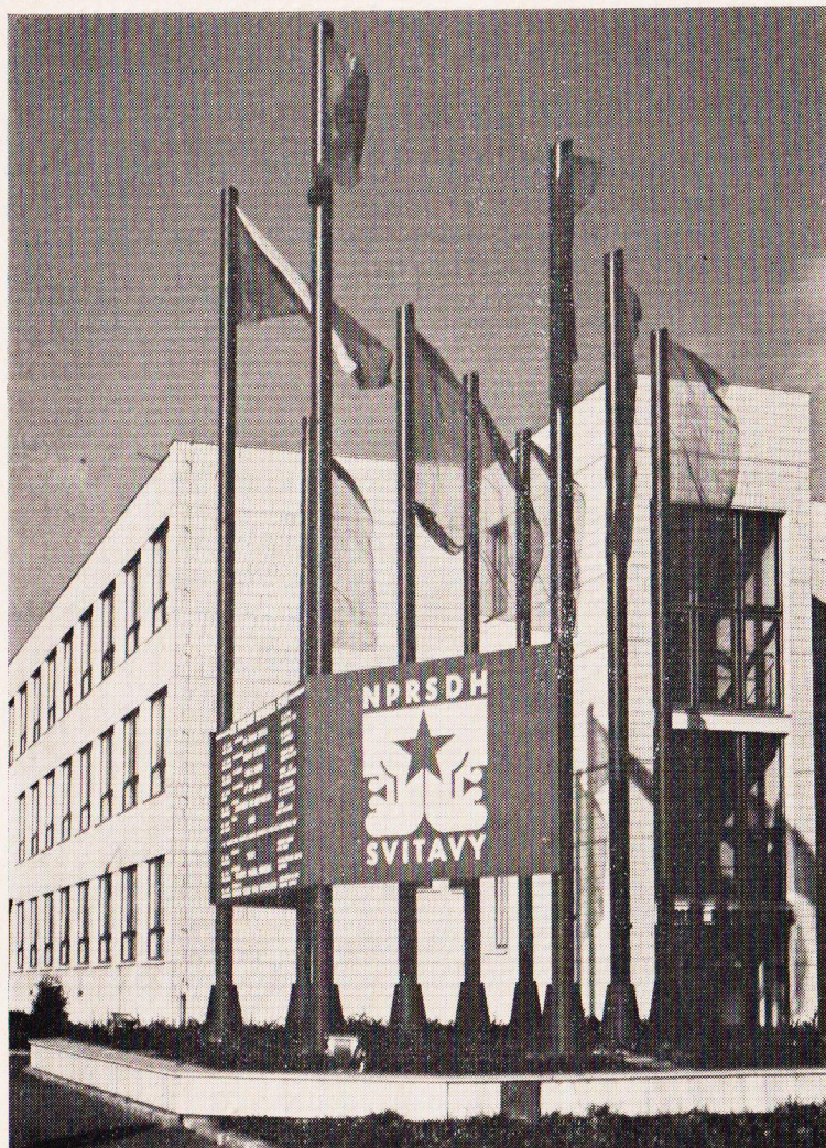
Budova domu odborů, místo konání posledních ročníků přehlídky.