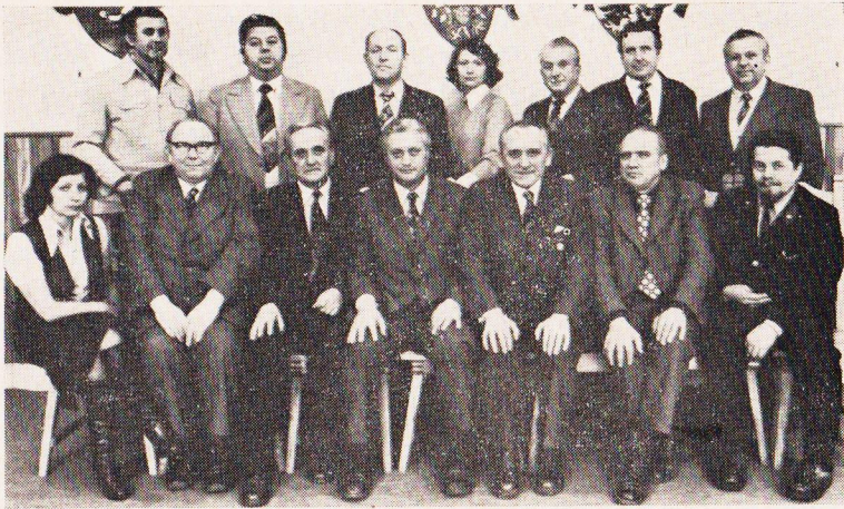
Zakládající řídicí výbor přehlídky.