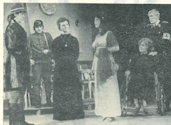
B. Brecht: Pušky paní Carrarové