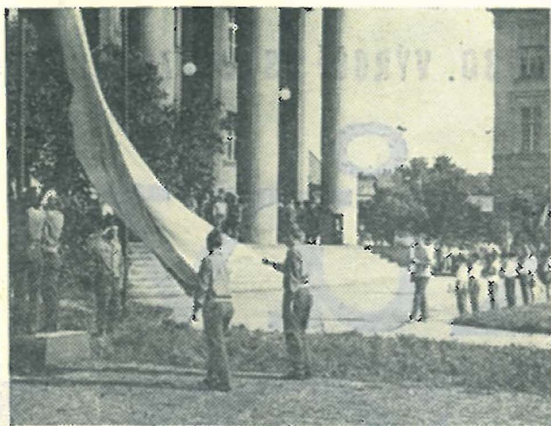
Zě zahájení jednoho z ročníků JH

NÁRODNÍ PŘEHLÍDKY AMATÉRSKÝCH DIVADELNÍCH SOUBORŮ NA POČEST 30. VÝROČÍ OSVOBOZENÍ ČESKOSLOVENSKA SOVĚTSKOU ARMÁDOU