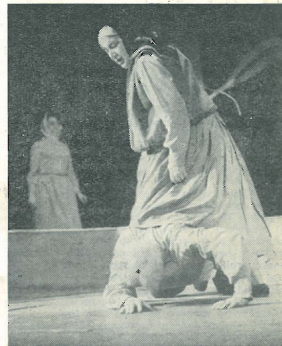
A. Makajonak: Tribunál