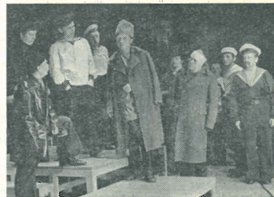
V. Višňevskij: Optimistická tragedie