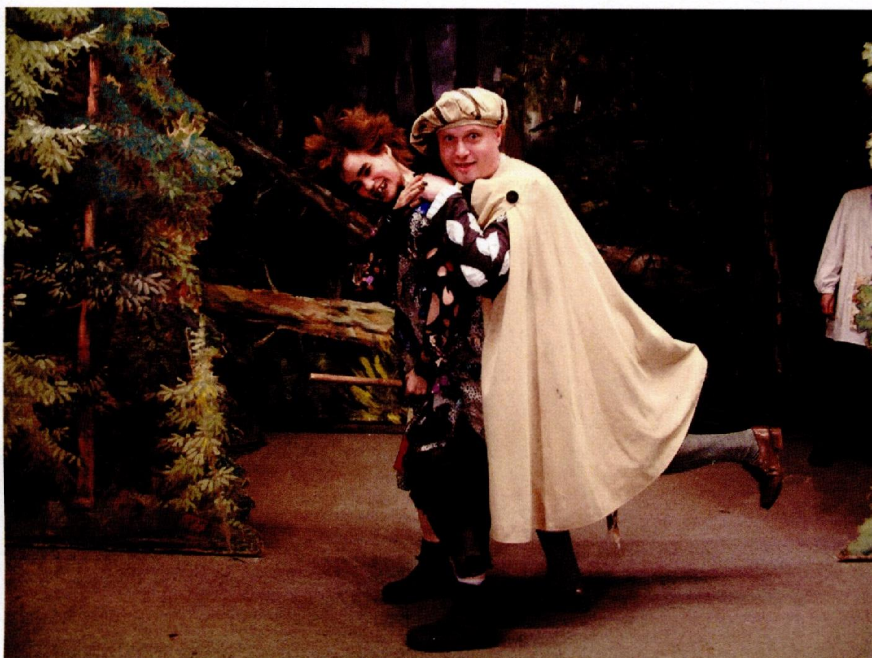
rádce a čarodějnice Minima