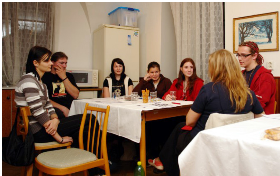
Diskuze klubu Mladého divadelníka.

Myslím si, že je to výborný nápad a že je to velice záslužné. S paní Čápkovou jsem se znala, bydlely jsme ve stejné ulici, takže je to pro mě i trochu nostalgie.