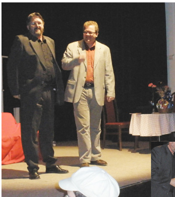
Foto z ukončení divadelního předplatného a vylosování výherců.