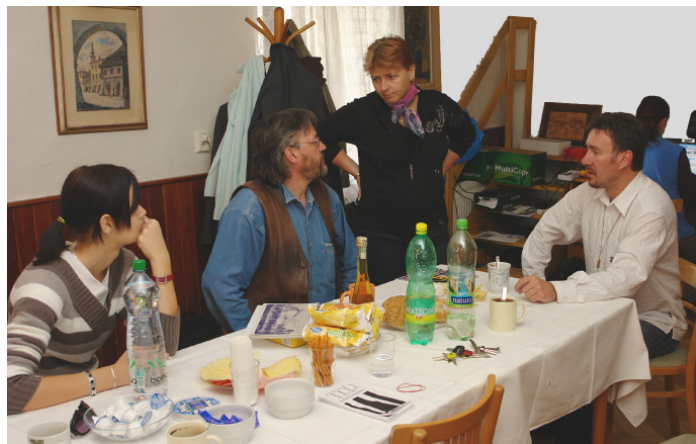
Organizace v plném proudu....

Líbí se mi tu, i když jsem tu vždycky strávil jen část večera. Bylo to tu výborné už tehdy, když jsme tu byli s Blbcem