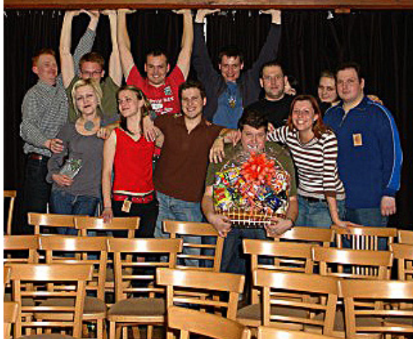
Vyškovský divadelní soubor v plné parádě.

Nápad je to senzační. Tyto festivaly se tady konaly do roku 1970. Potom to odchodem pracovníků z kultury zkrachovalo. Jsem moc rád, že se to teď zase obnovuje a že se lidé můžou seznámit s tím, jaké jsou na Moravě ochotnické soubory. Byl bych rád, kdyby to neskončilo prvním ročníkem. Jsem přesvědčený, že festival bude pokračovat dál.