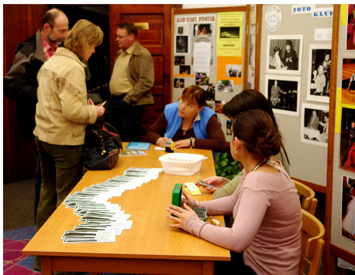
A diváci již přicházejí...

I. ročník přehlídky ochotnických divadelních souborů pořádaný pod záštitou hejtmána Zlínského kraje KROMĚŘÍŽ 17. - 20. dubna 2008