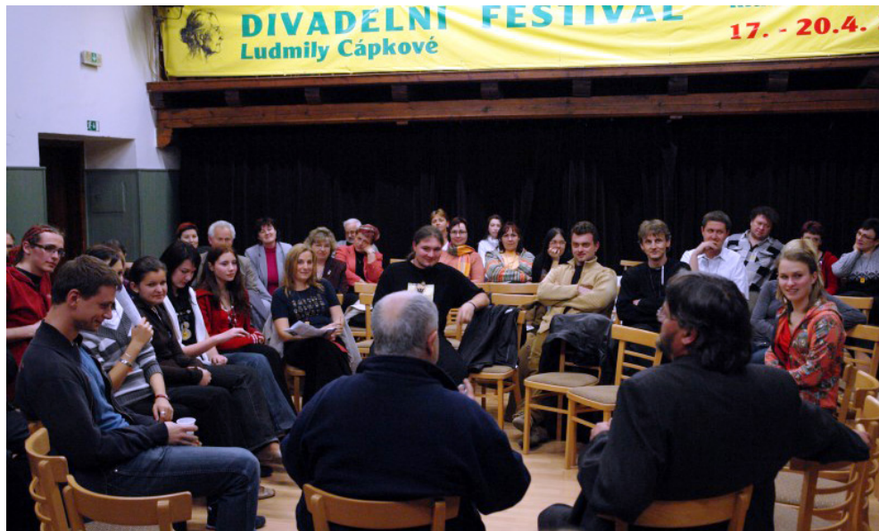
Veřejné povídání v symbolickém kruhu o shlédnutém představení.

Moc bych si přála, kdyby budoucnost měl, protože to, co se tady děje i na diskuzích po představení, je pro všechny velkým přínosem. Já sama jsem ještě nikdy nic takového nezažila a moc se mi to líbí. Ti, kteří tady u toho nejsou, můžou jenom litovat.