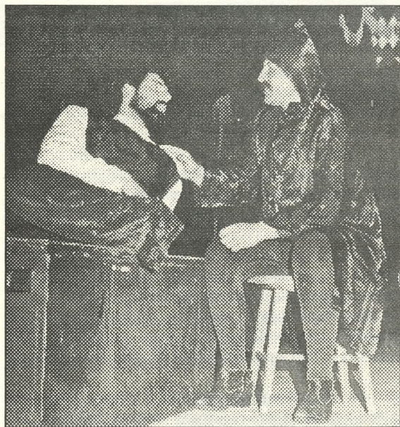
Z festivalu Divadelní Bechyňe '94