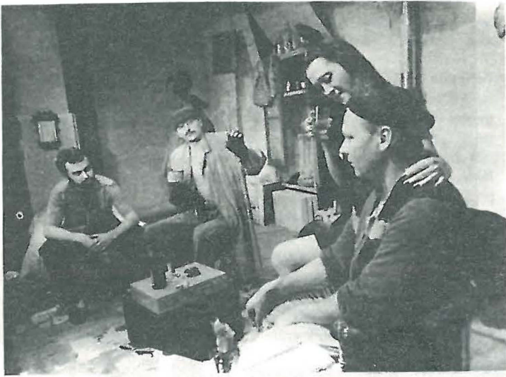
Malostranská beseda Praha - Hodinový hoteliér