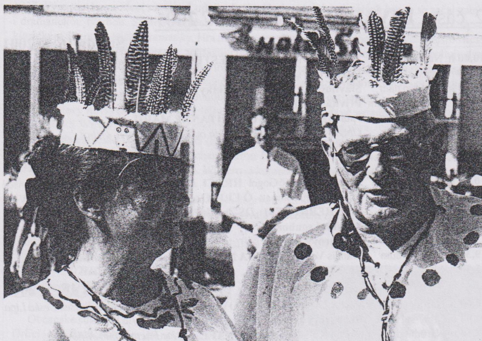
Vzpomínka na loňskou "indiánskou" Divadelní Třebíč