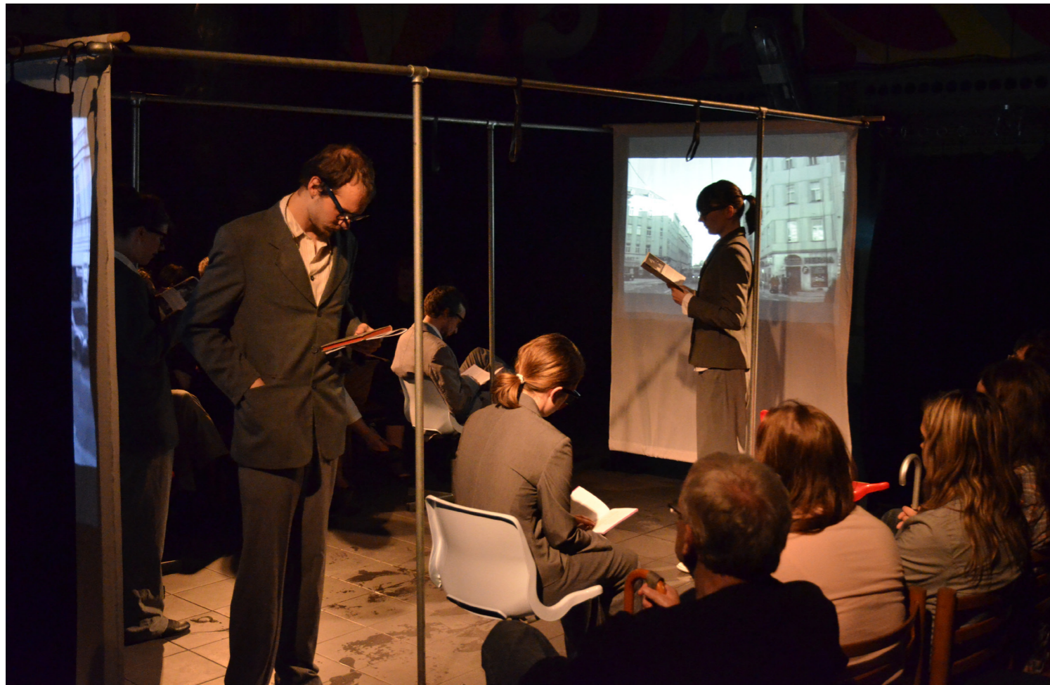
2011 Divadlo Potrvá Praha: Bílá hora 70/22