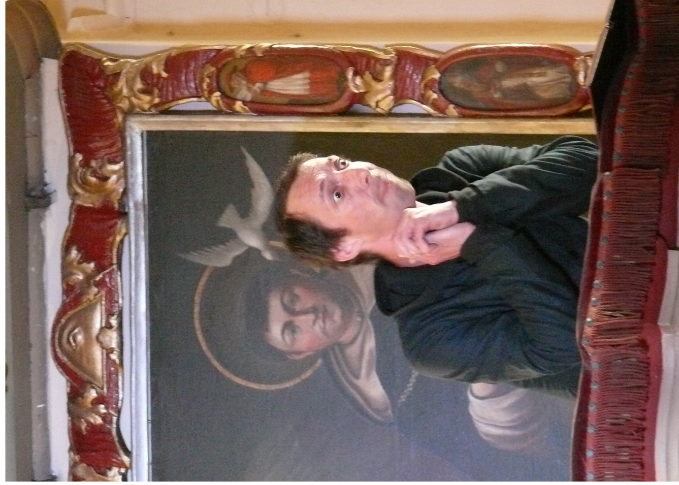
2011 Geisslers Hofcomedianen Kuks: Ambrosia