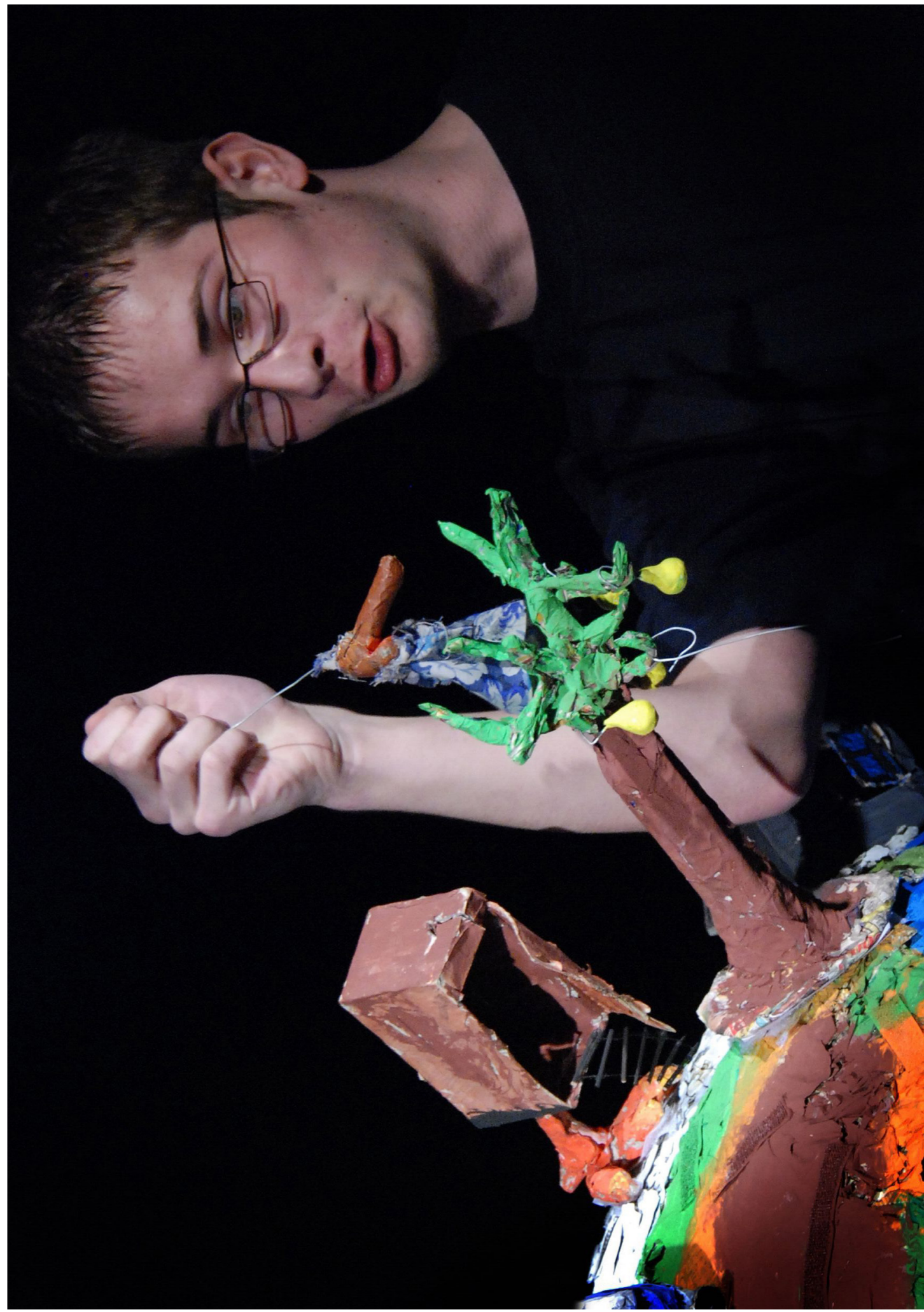
2009 Někdo ZUŠ F. A. Šporka Jaroměř: Ve dvě na hruškách II