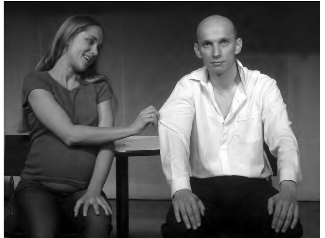
2007 Antonín D. S. Praha: Dítě!