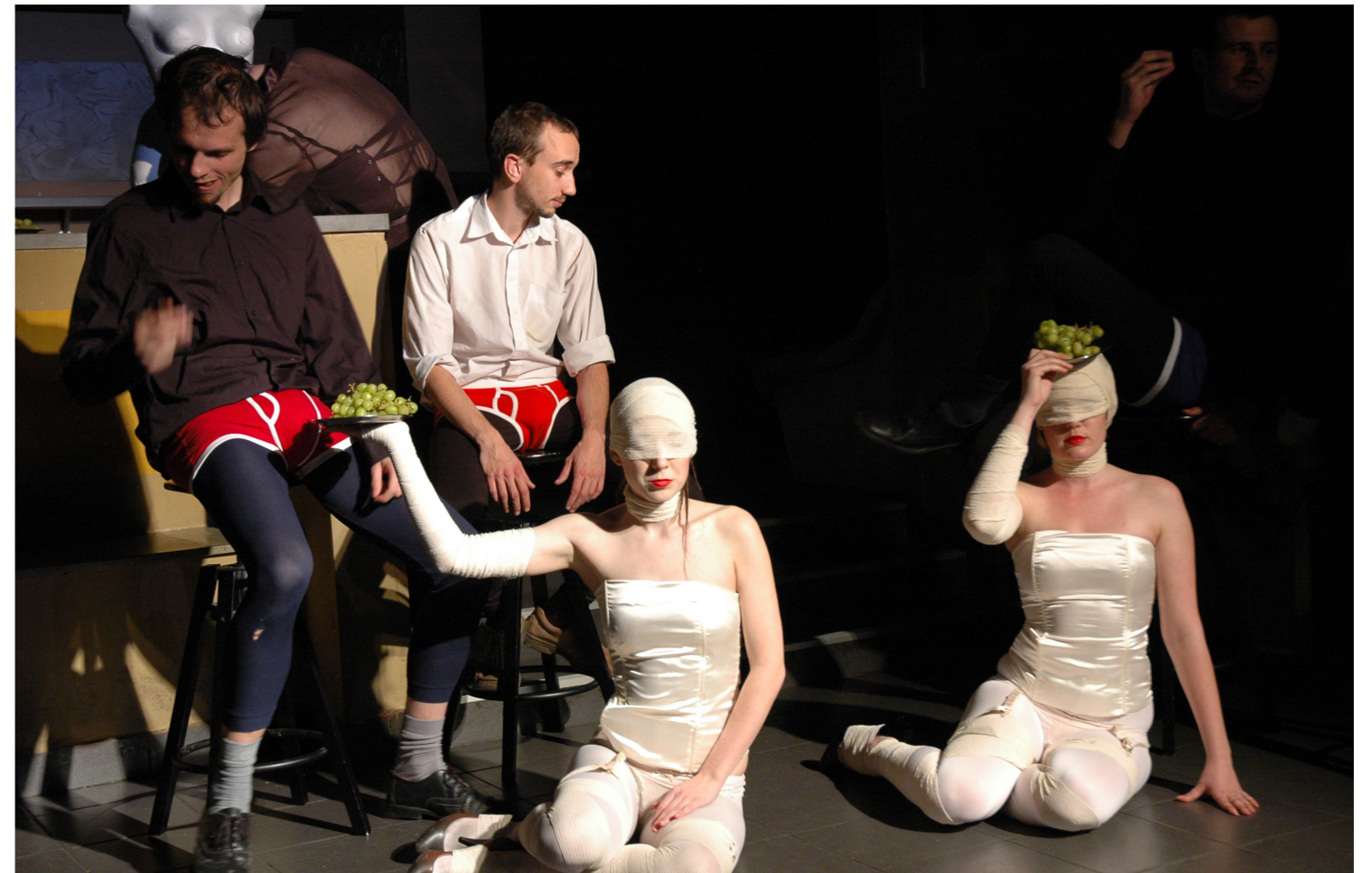
2010 Potrvá Praha: Romeo: Poslední štace?