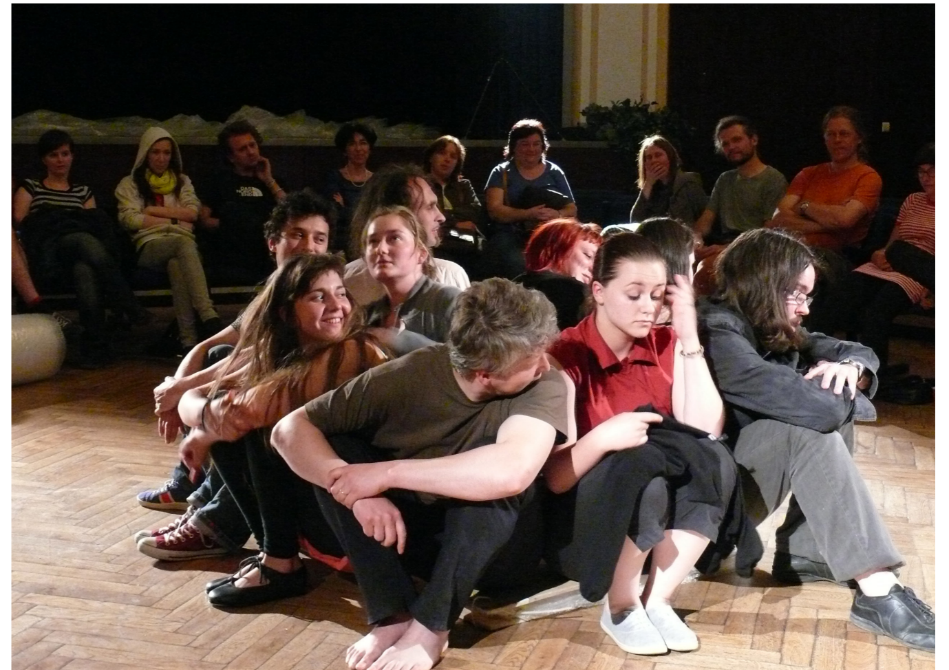
2011 J.S.T.E. & D.R.E.D. Kladsko/Praha/Olomouc: Kukající anjel