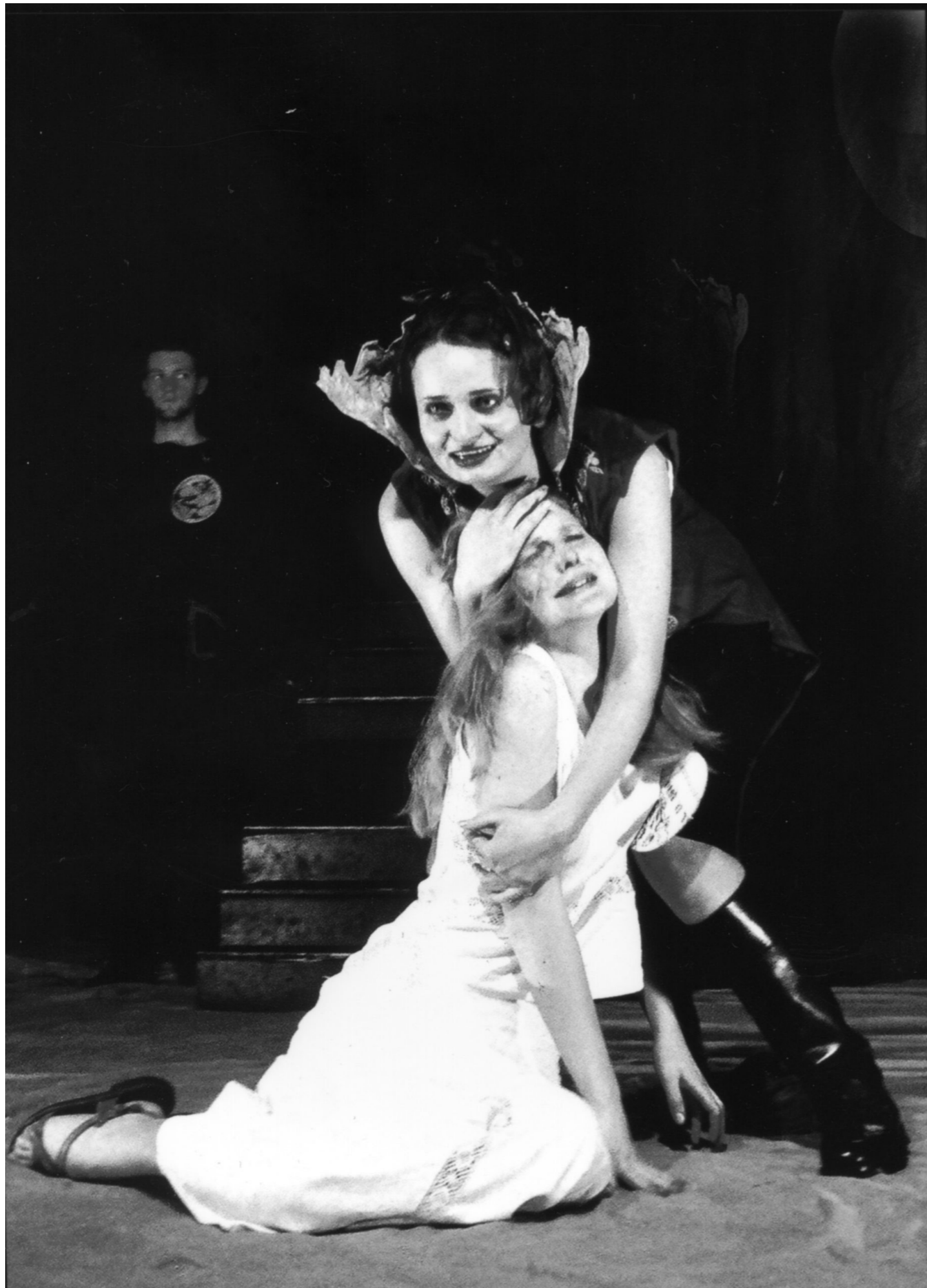
2002 Divadlo Jesličky ZUŠ Na Střezině Hradec Králové: Drak