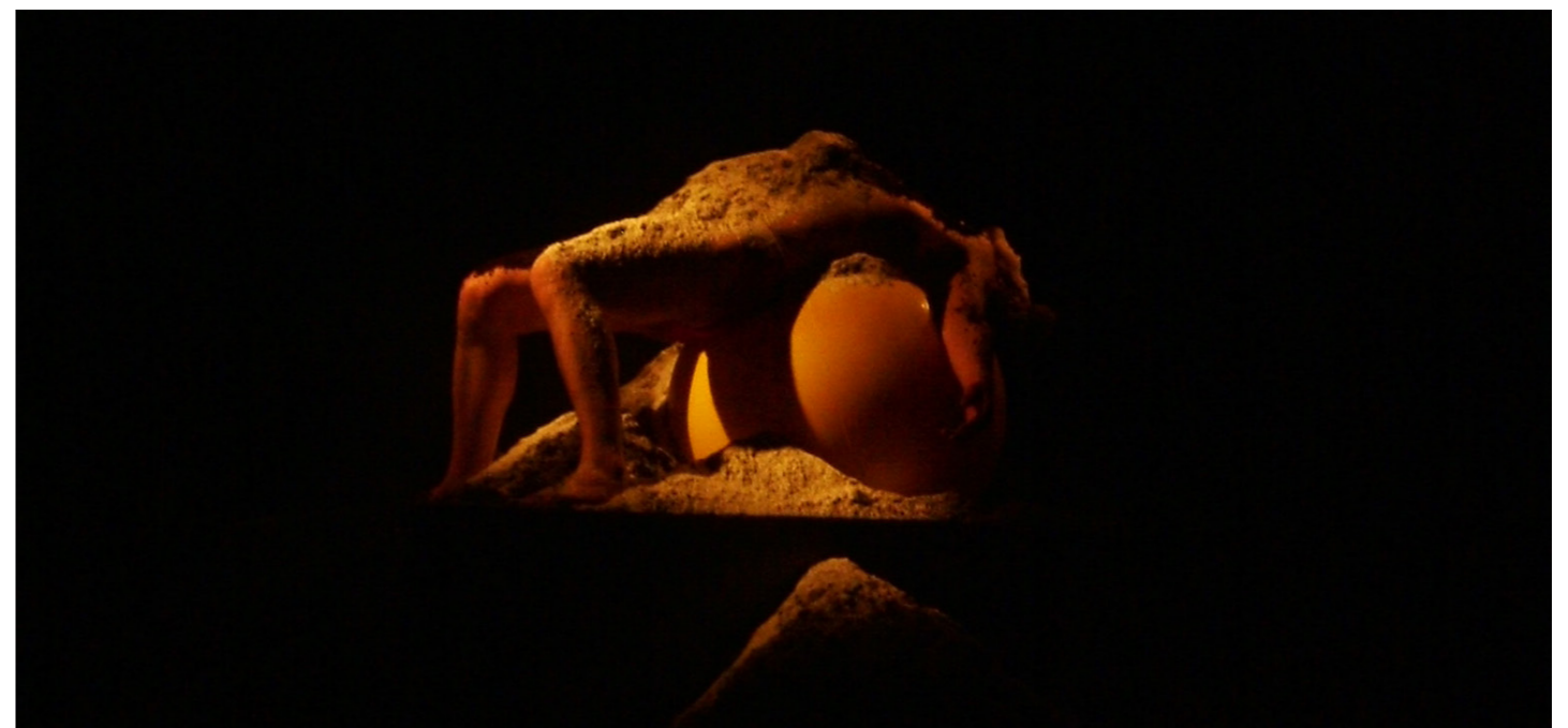
2006 J.S.T.E. Artyžok a DRED Náchod: Lehká zemitá plocha. Smirk.