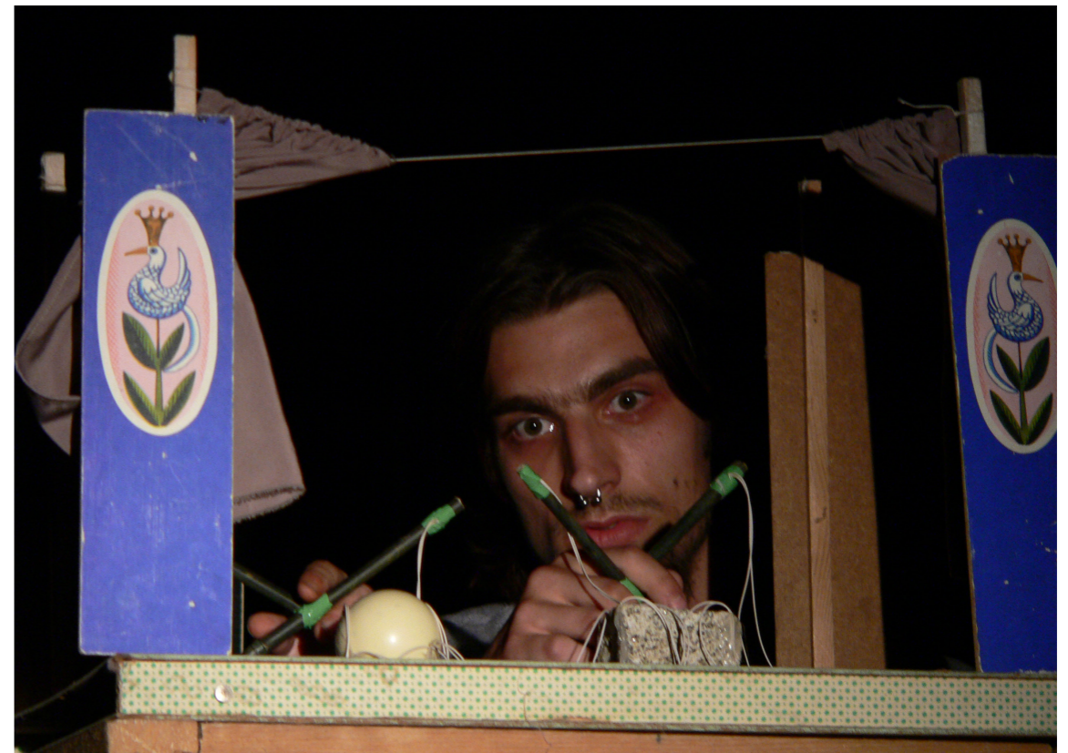
2006 Pachýř Pačejoff Plzeň: Koláž sledovanosti