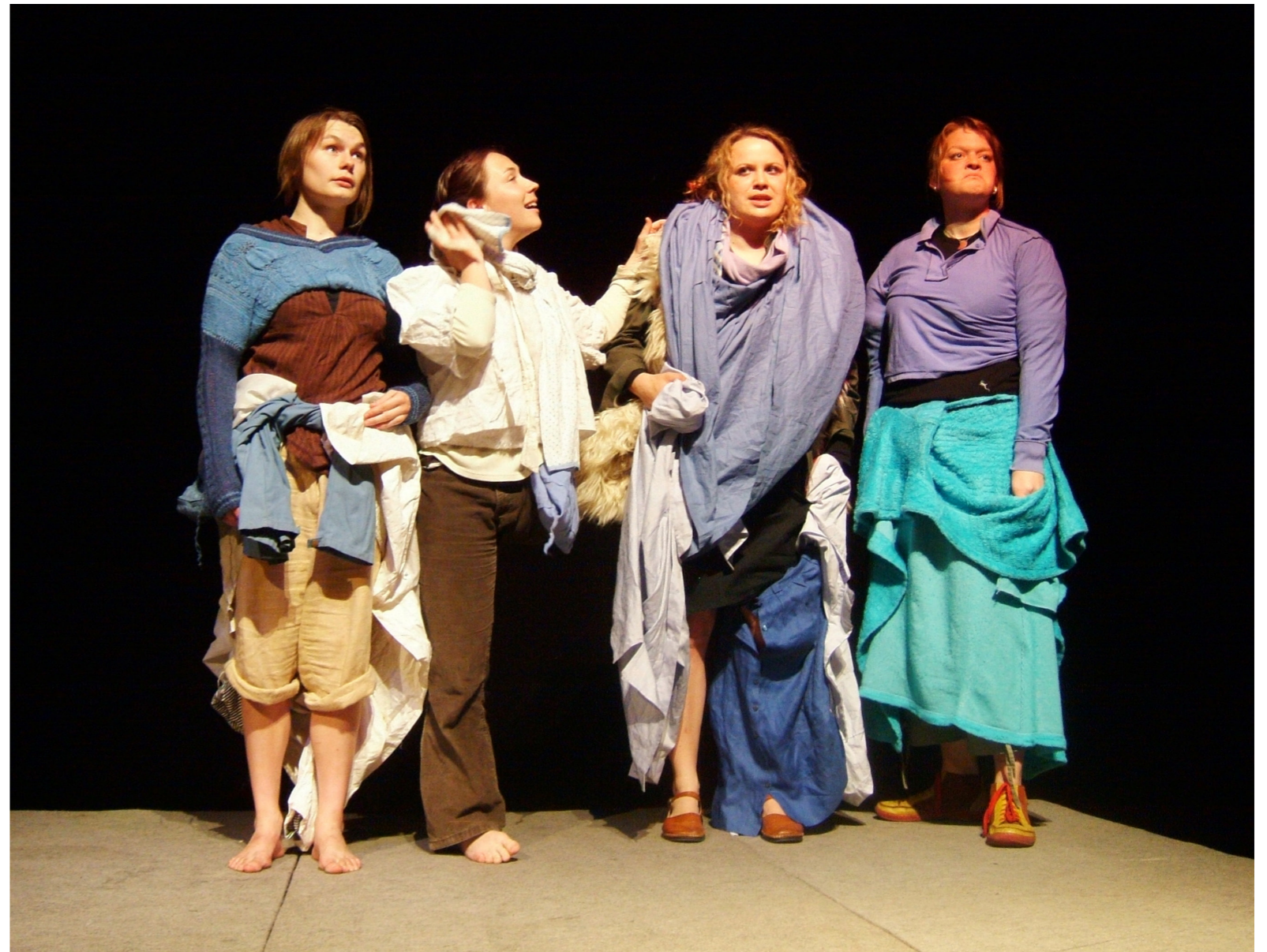
2006 Dno Hradec Králové: Nepokojíčky