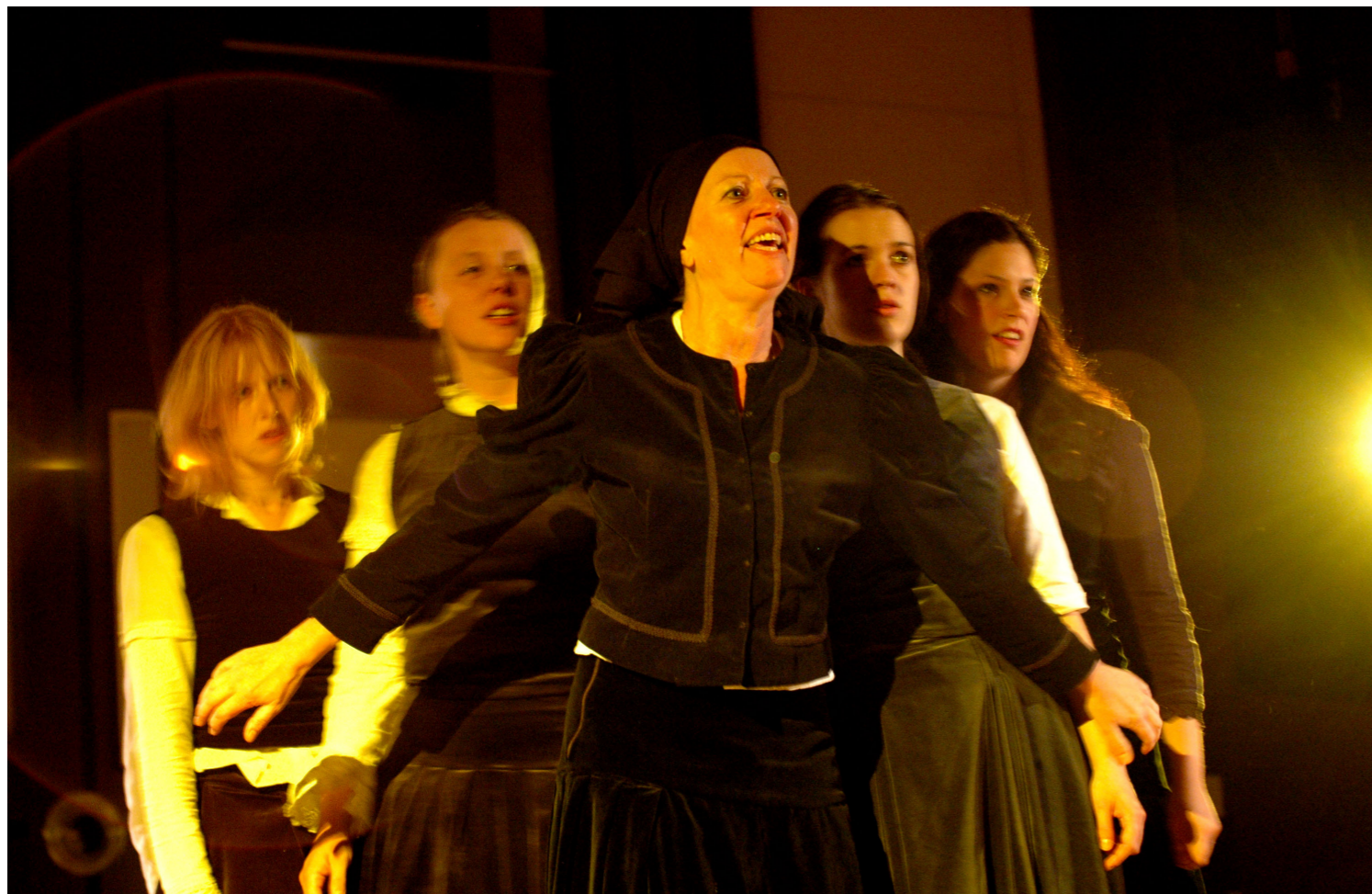
2011 Evrybáby a hosté Plzeň: Dům Bernardy A.