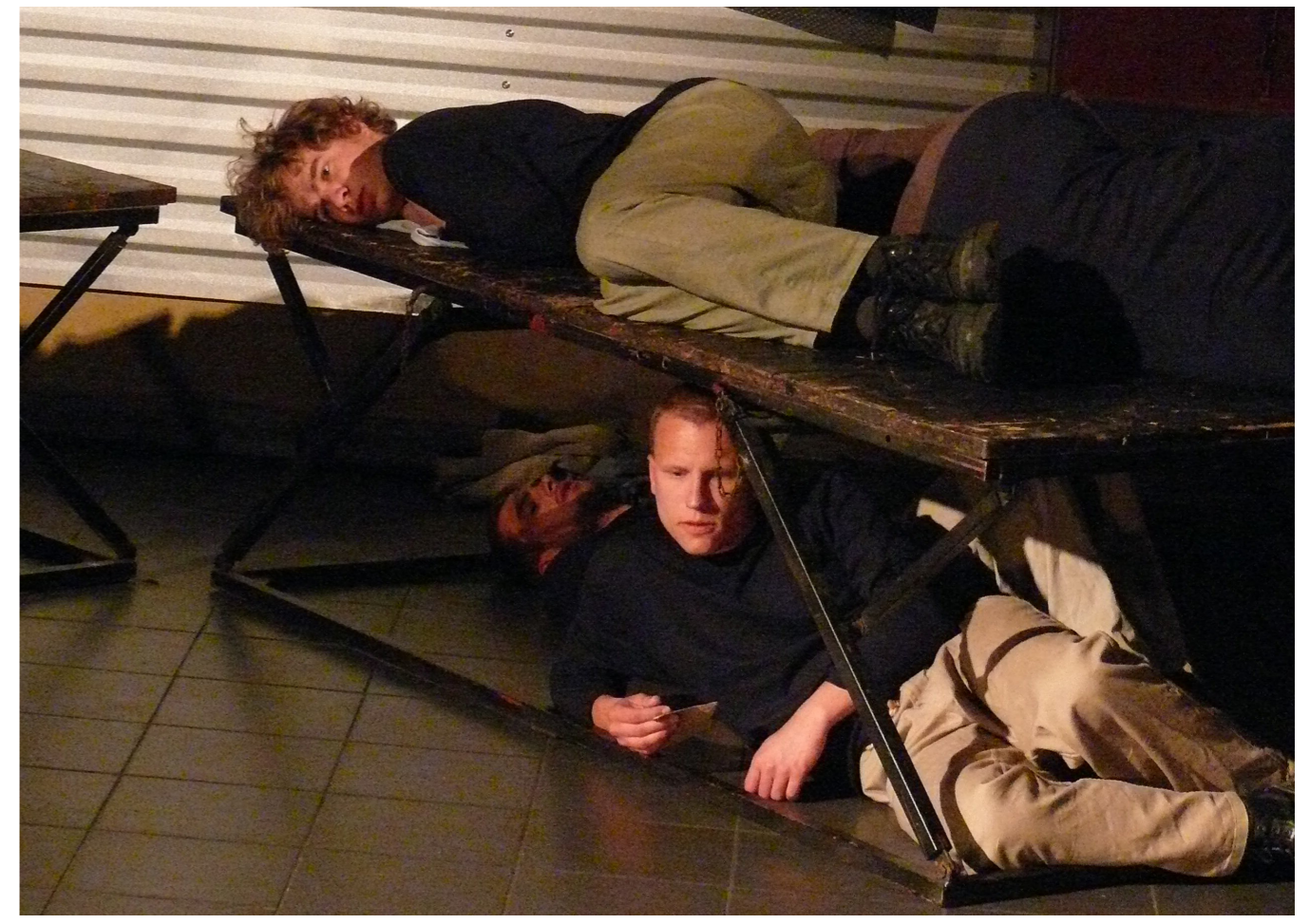
2011 Studio Divadla Dagmar a pedagogické školy Karlovy Vary: Pozdravuj všechny doma