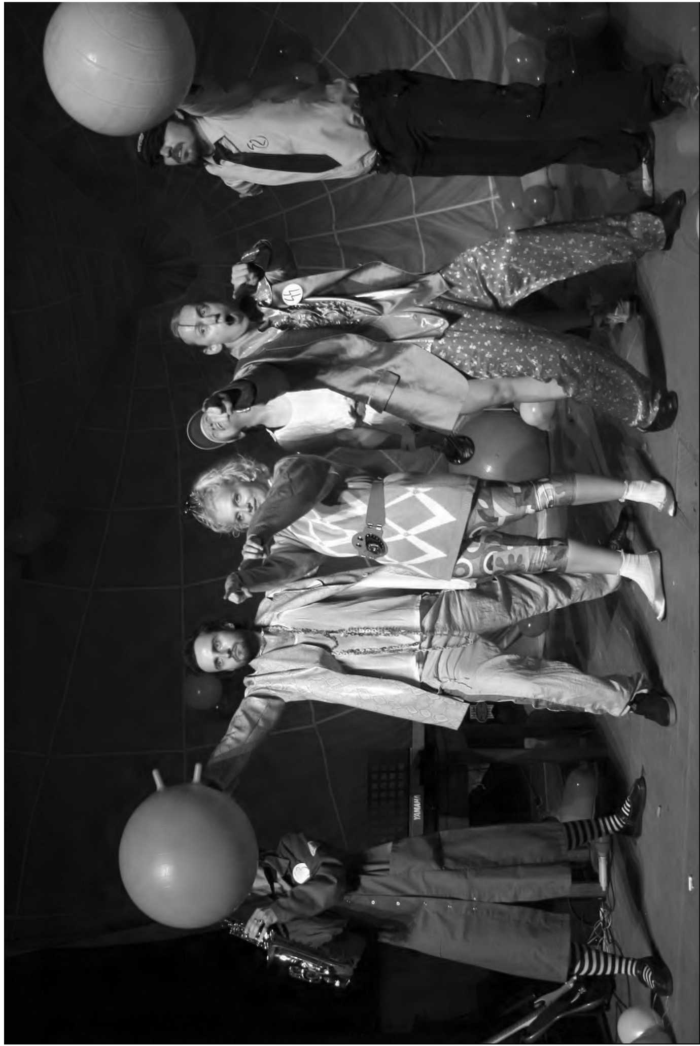
2007 Geisslers Hofcomoedianten Kuks: Serpillo a Melissa aneb Tymián a Citroník randeshow