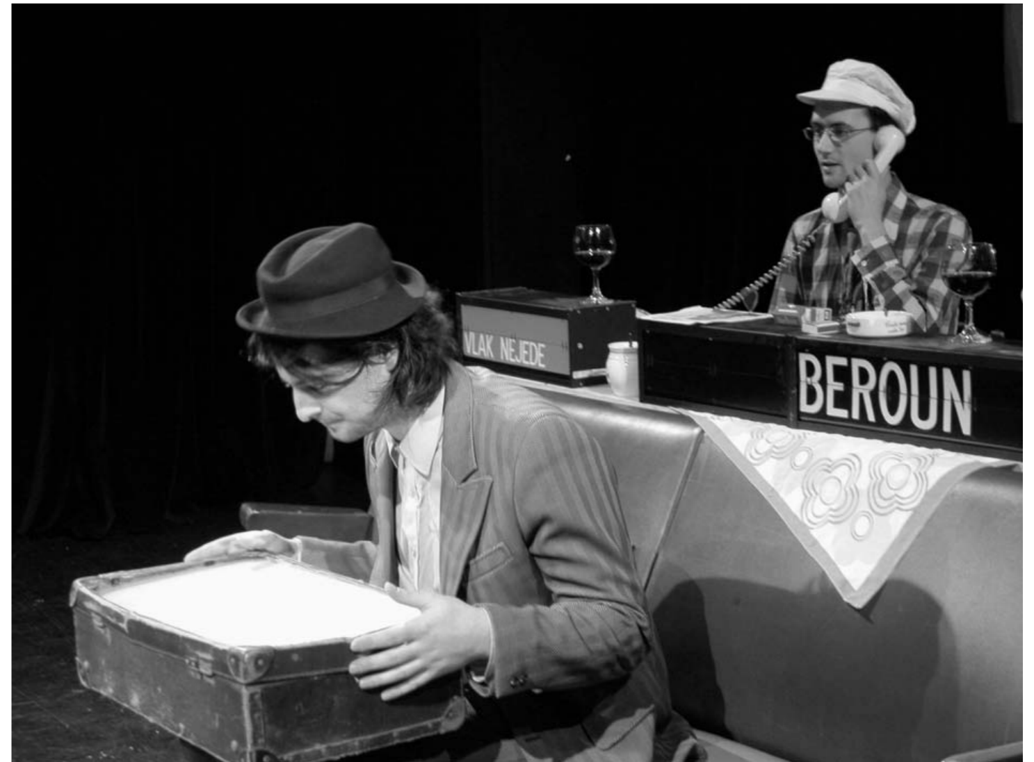
2005 Divadlo Vosto5 – Divize Teatro Piccolo Primitivo Praha: Košičan 3