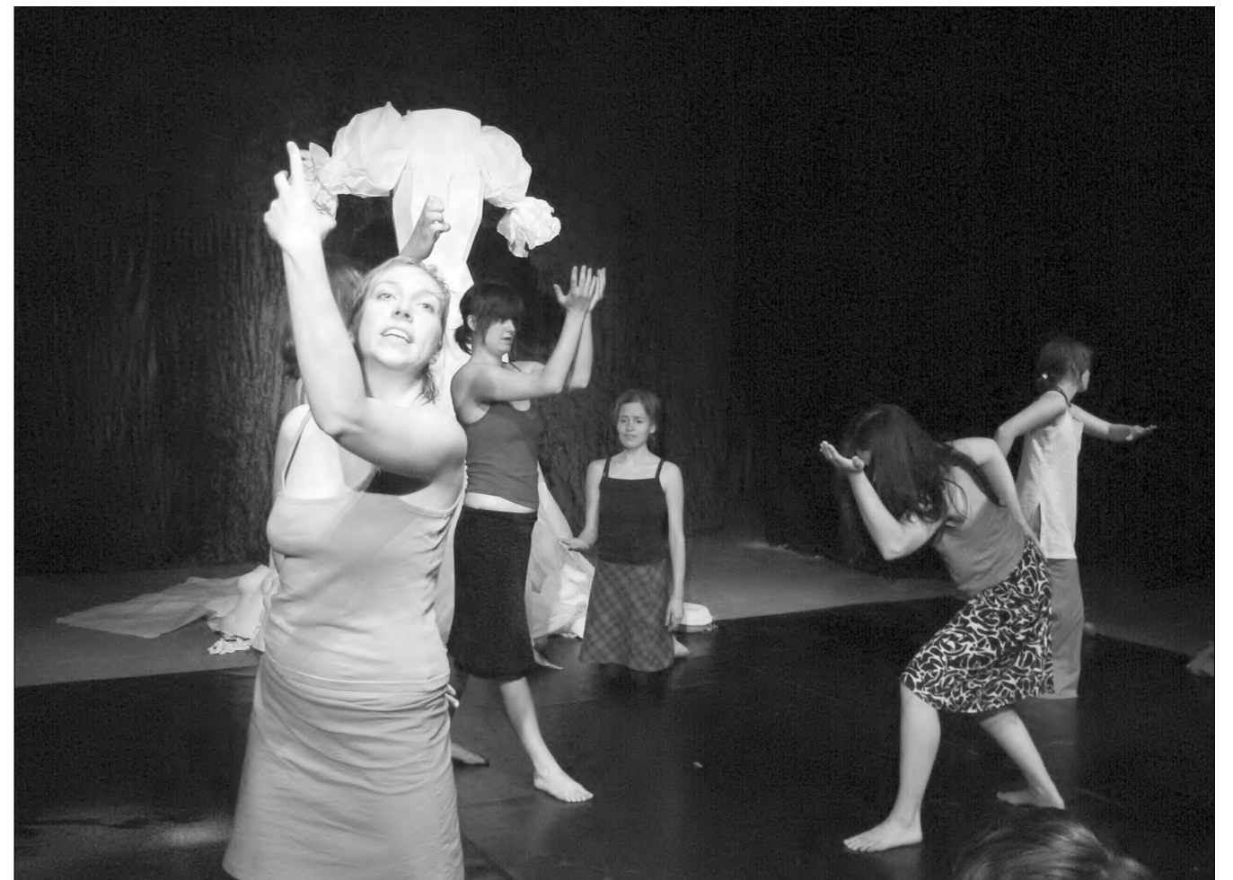
2007 Evrybáby Plzeň: Osmá sedí u stolu a pojídá mou mrtvolu