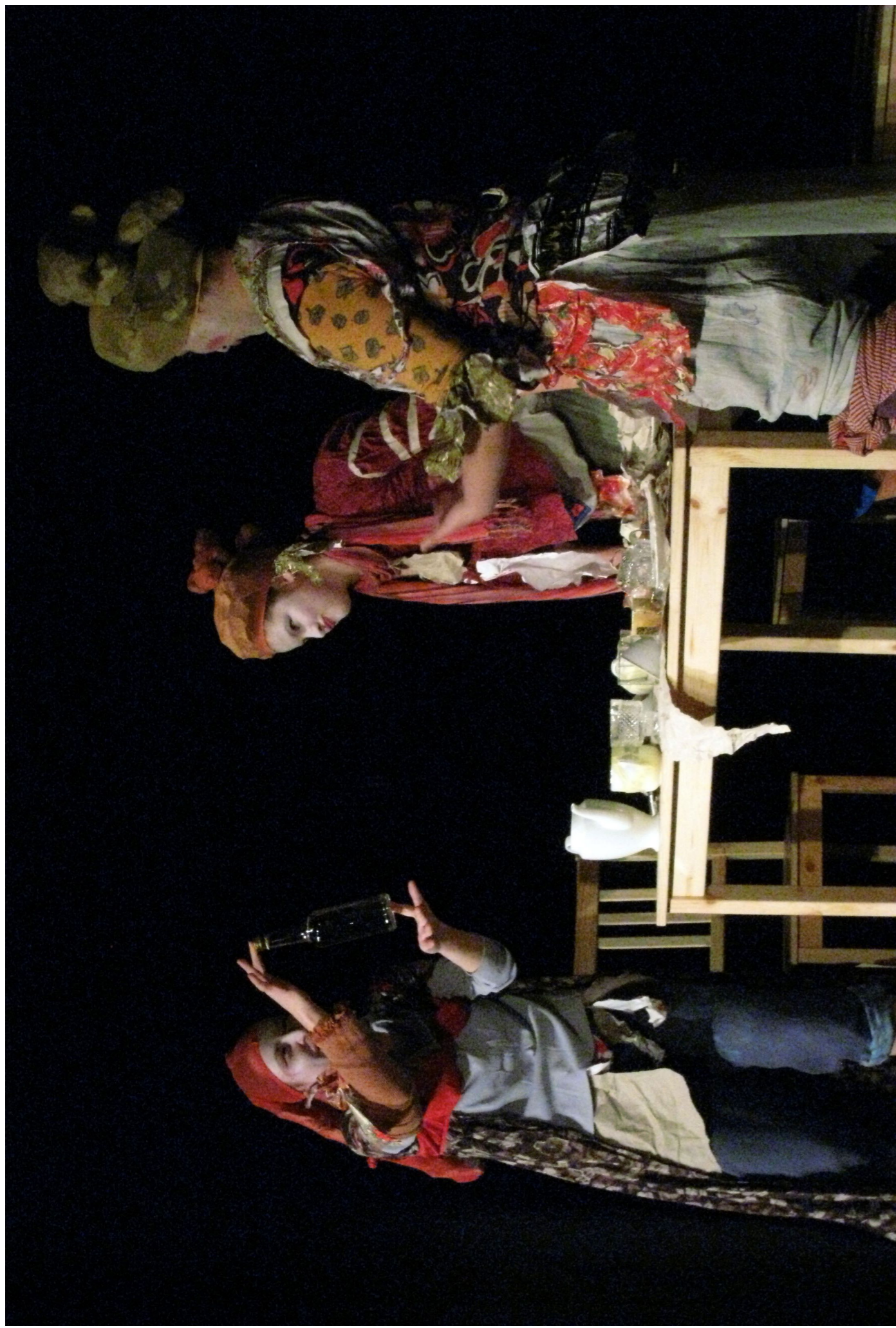
2009 THeatr Ludem Ostrava: Narozneniny