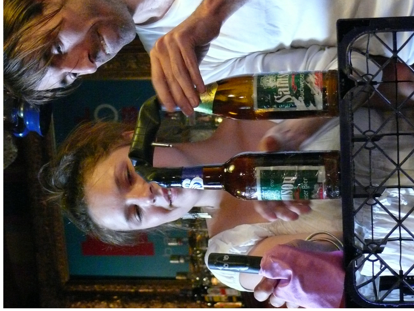
2011 Divadlo DNO Hradec Králové a Šavgoč Brno: Hospodin aneb Kdopak by se boha bar