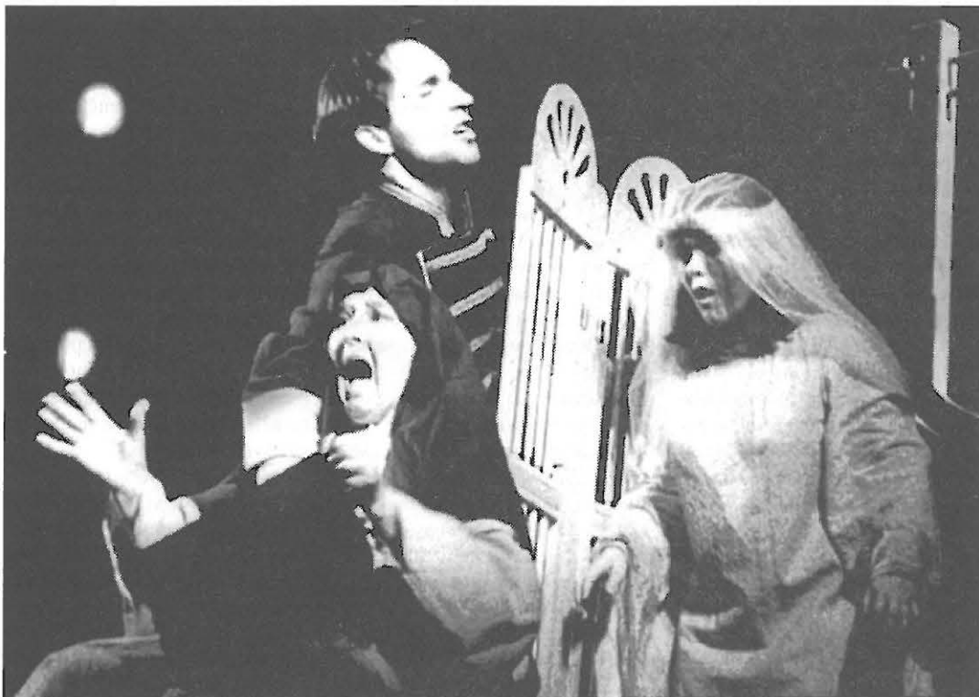
Mam'zelle Nitouche-ky aneb Láska kvete v každém věku Ořečovské divadlo Ořechov

Vítězný navříň ovšem může zdobit nejen skráně celého souboru, ale rovněž tak i výjimečně udatného jedince, který se vyznamená coby herec či výtvarník kapitálního talentu. V tom se nám jeví princip Zlatého Aloise otevřenější a vpravdě demokratičtější, narozdíl od laciných cen typu Oscara. A nyní již můžete netrpělivě čekat na sobotní večer, kdy se krátce po odpálení ohňostroje dostane Zlatý Alois zvaný II. ke svému zbrusu novému majiteli. (zat)