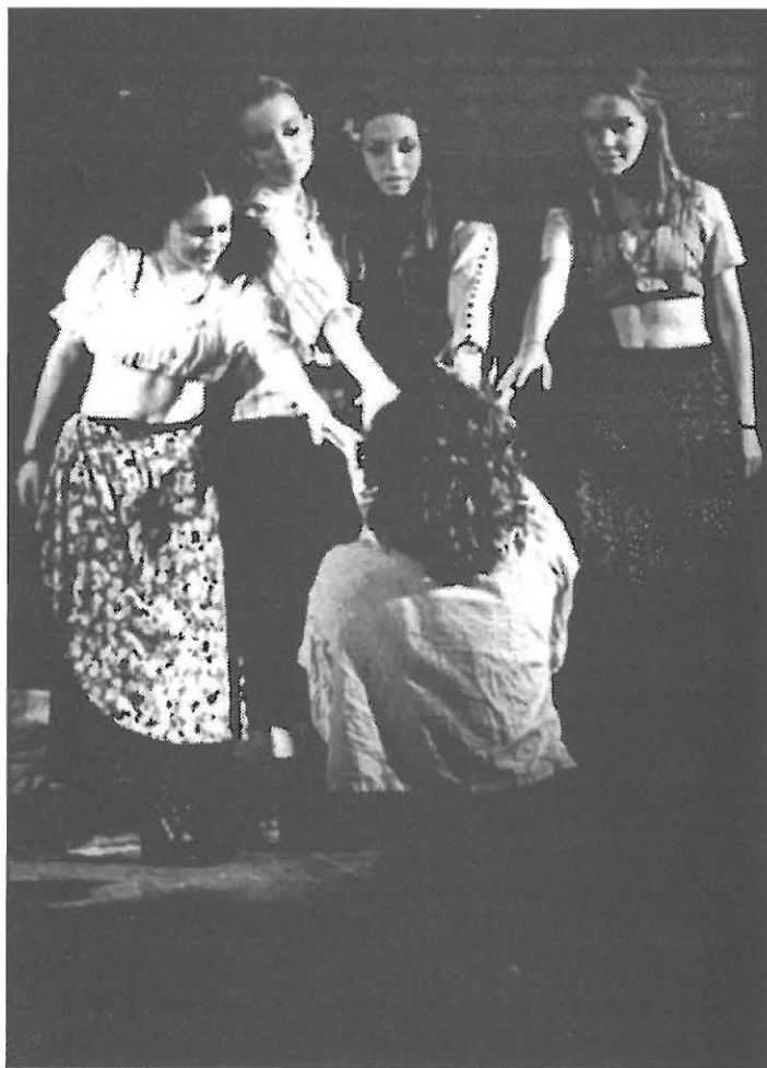
Milá sedmi loupežníků... - Divadélko Jesličky, scéna ZUŠ Na Střežině Hradec Králové