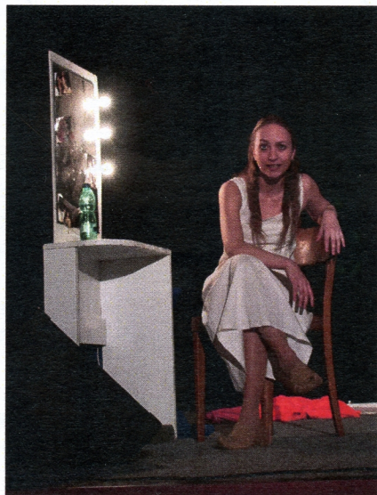
Divadelní studio Dialog, Brno

Hra byla poddána výrazně monotónně a bohužel to nezachránili ani excelentní herecké výkony. V očích obecenstva však jimi hru