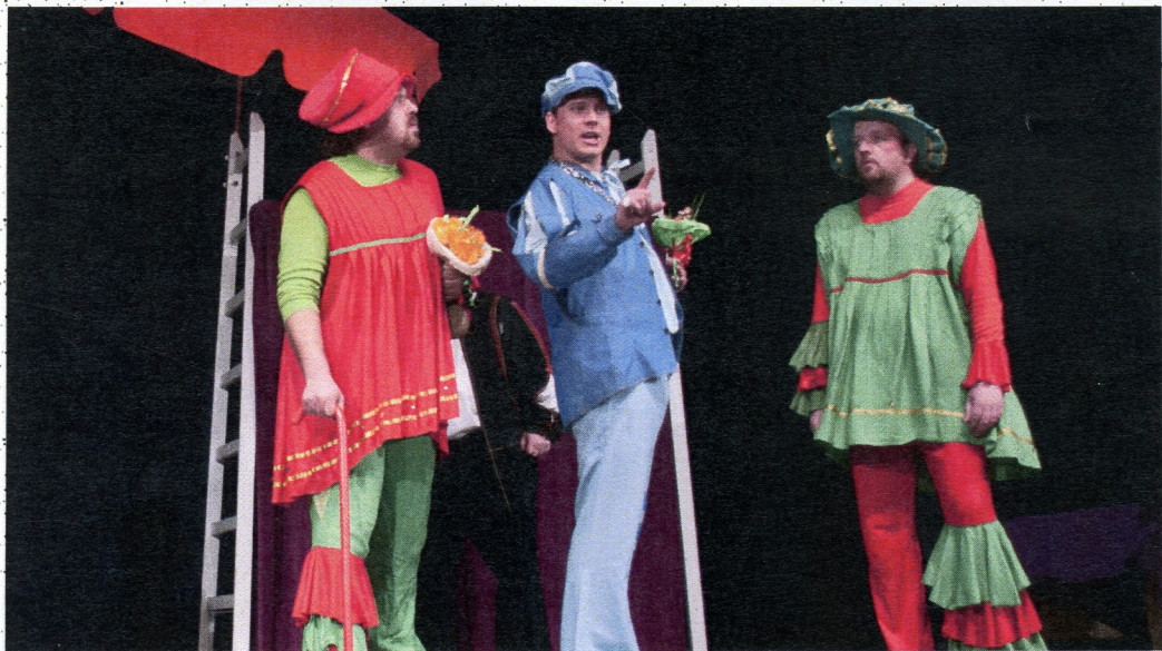
Tak se krotí ženské, Divadelní studio Dialog, Brno