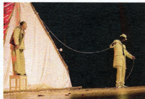
Záhorácké divadlo Senica

Hra pojednává o vidině ráje a pekla na zemi. Hlavní postava Jaska se chystá oběsit, do čehož přichází na scénu čert představující záhoráckou alternaci Fausta a nabízí mu lepší život. Ve hře se řeší otázka volby i biblická témata.