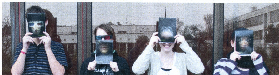
Přehledka zpravodajů v rukou redaktorů