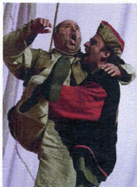
Záhorácké divadlo Senica

Záhorácké divadlo Senica, které působí od roku 2006, je na Hobbliku stálým hostem. V závěru festivalu tak svým nesoutěžním představením doplňuje divadelní repertoár celé přehlídky. Místní diváci si na nápaditou a vtipnou skupinu herců již zvykli a každoročně jejich představení hojně navštěvují. Letos se nám předvedli s novou hrou.