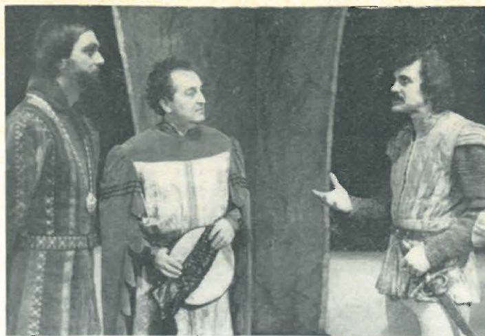
K inscenaci „Jana Roháče“ v provedení hronovského divadelního souboru SZK ROH MAJ se vracíme ještě jednou obrazně.