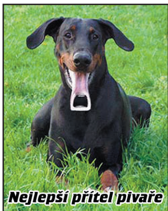
Nejlepší přítel pivaře