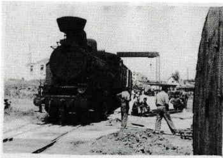
Prakab měl od počátku vlastní železniční vlečku, na fotografii je zachyceno vypravení slavnostní zásilky pro Sovětský svaz v roce 1946