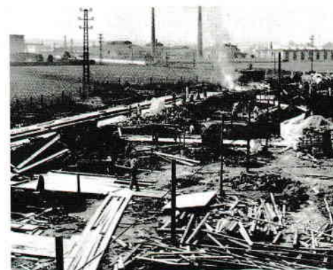
Část pozemku kabelovny se siluetou průmyslové Hostivaře ve 40. letech

Ačkoliv nikdo z kruhu rodiny kolem Emila Kolbena nepatřil k ortodoxním židům, tvrdě antisemitský nacionální socialismus požadoval jejich okamžité odstoupení z funkcí. Rodina o hroznou situaci věděla, Německo svůj antisemitismus ve-