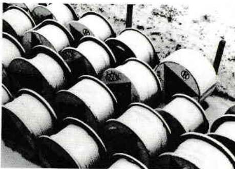
Po nacisty vynuceném prodeji splynula kabelovna s firmou Františka Křížíka