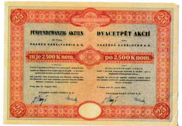
Akcie hostivařské kabelovny z doby druhé světové války

Přes smutně tragický příběh Kolbenovy rodiny, Prakab v době války prosperoval velmi dobře. Spojení s Křížíkovou firmou a převod na akciovou společnost vedly k dalšímu posílení továrny a jejího odbytu. Předně bylo rozhodnuto, že v podniku bude zavedena nová výroba silových a sdělovacích (telefonních) kabelů. Díky tomu vyrostla v Hostivaři nová trojlodní hala se segmentovou střechou na ploše necelých 4000 m 2 .