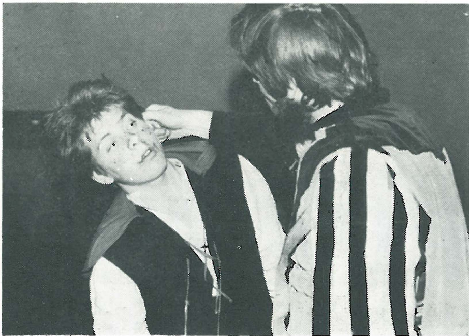
Včera zhlédli hronovští diváci sázavskou inscenaci dramaturgie Jiráskovy novely