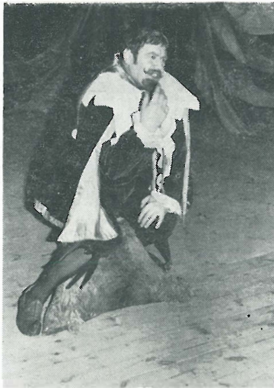
Ze sázavské inscenace Maryly.