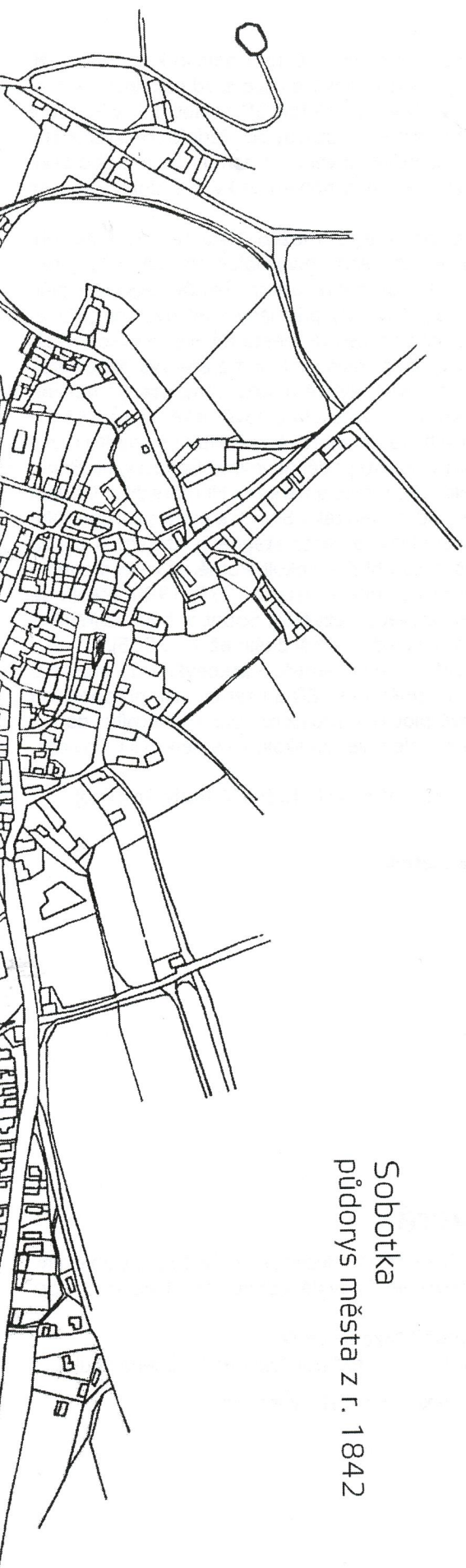
Sobotka půdorys města z r. 1842