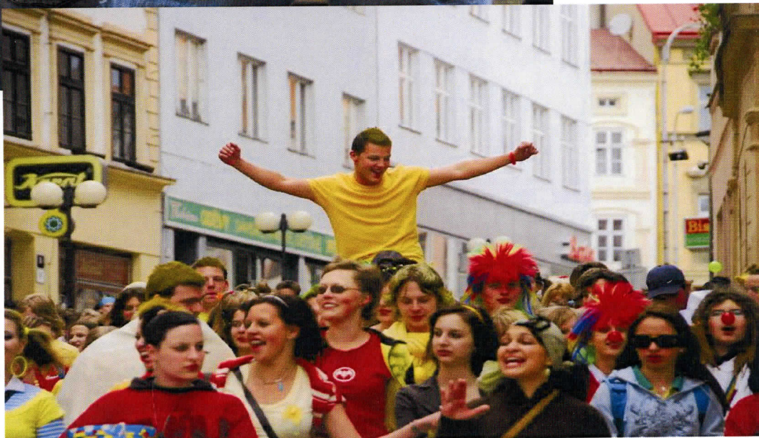
Gymnázium a Střední odborná škola pedagogická Znojmo