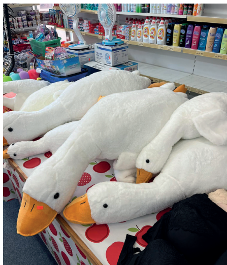
Husy ( z obchodu na náměstí)