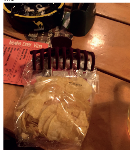
I jídlo může mít oblečení