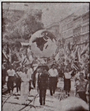
Záběr z průvedu účastníků I. SFMS v Praze

V. festival - Varšava: 30. července-14. srpna 1955, 30 000 zahraničních delegátů ze 114 zemí