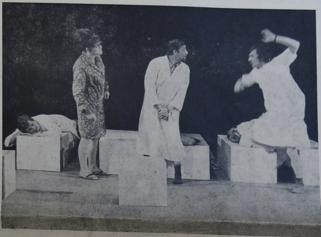
Mladý soubor Divadélko pro 111 z Českých Budějovic se představuje vlastní úpravou komedie Když rozkveté akát.

Stůl svitavských divadelníků zažil jedno velké překvapení. Při losování — zvláštním řízením osudu — si štěstí přisedlo i k nim. Vedoucí odboru kultury vyhrál šaty. Všichni kvitovali s povděkem a k šatům přidávali ještě upřímně míněné gratulace. (LK)