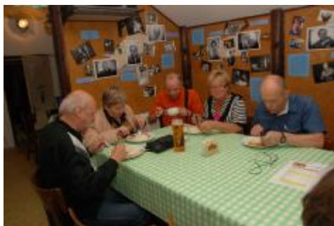
I takhle vypadá vysocká přehlídka