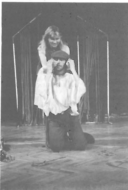
„Indické pohádky“ - DDS Hudradlo Zlivi

Šefrnovci nezklamali. I když: jak koho. Osud prověřovatel jim tentokrát umožnil zasadit křehkou produkci do tak velkého sálu (Jiráskovo divadlo), že odmítnutí už přeci muselo odněkud přijít - alespoň ze zadních řad... I když: kdo chtěl, mohl se mít i v zadní řadě. Snad. Kdo chtěl. Ale kdo nechtěl, sesbíral souzněžící