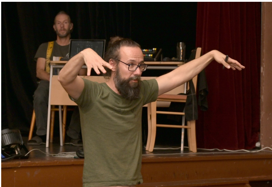
STDK společně s klubem režisérů SČDO uspořádal včera po obědě pro zájemce kurz divadelní techniky, konkrétně svícení.