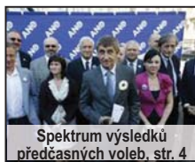
Spektrum výsledků předčasných voleb, str. 4