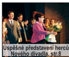
Úspěšné představení herců Nového divadla, str. 8