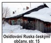
Osidlování Ruska českými občany, str. 15