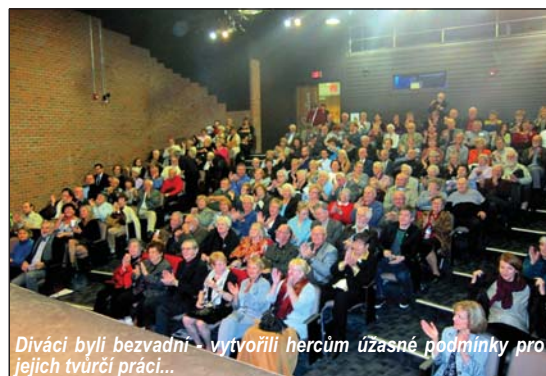
Diváci byli bezvadní - vytvořili hercům úžasné podmínky pro jejich tvůrčí práci...

Jenom pro zajímavost si vyjmenujme, jak šly některé scény po sobě, nepočítaje v to hudební čísla a písně sólistů – Světáci v restauraci, Maringotka - diskuse světáků, Krejčovský salon, Trčkové rozbité okno, Trčková byt se Zuzanou, Trčková byt - milenecká scéna s Božkou, Maringotka - výměna fotek na zdi, Světáci v knihovně, Policejní stanice, Maringotka - album s profesorem, Světáci u Trčkové o lekci, Jaroušek u Trčkové, Maringotka - světáci mají konverzaci s profesorem, Restaurace - Trčková se světáčkami, Trčkové byt - sedí u ní světáci, Světačky studují své role