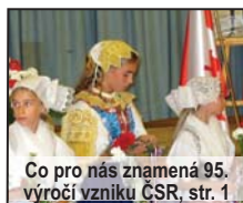
Co pro nás znamená 95. výročí vzniku ČSR, str. 1