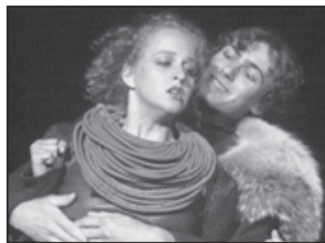
Hrátky milenecké i hříčky ochotnické v podání pražských studentů DAMU včera před půlnocí v parku A. Jiráska.