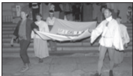
Vztyčení festivalové vlajky a průvod do parku