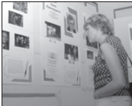
Výstava ve foyeru Jiráskova divadla

Dne 22. dubna 2004 zasedala komise pro udělování Zlatého odznaku J.K. Tyla, která schválila 13 návrhů předložených signatáři Statutu ZO JKT. V letošním roce k zakládajícím organizacím tohoto morálního oceňování osobností amatérského divadla přistoupilo Občanské sdružení divadelních ochotníků z Ústí nad Orlicí jako v pořadí již sedmá organizace. Seznam nositelů ZO JKT včetně uvedení navrhuje organizace, příslušnost k souboru a citace ocenění následuje: