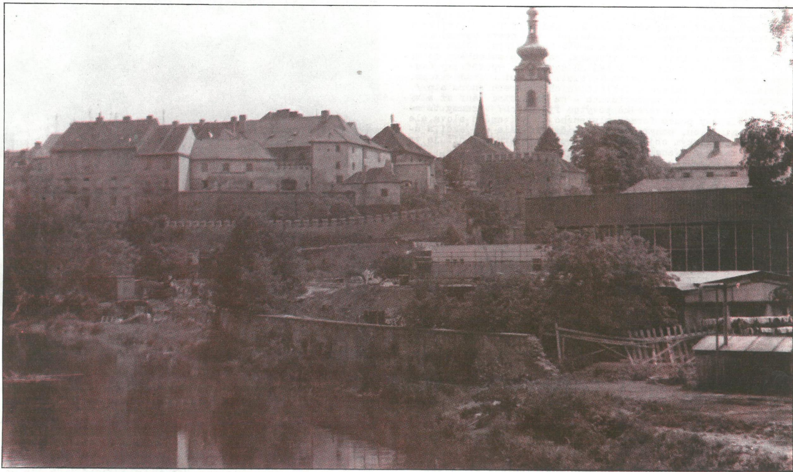
Šrámkův Písek jako inventura

ZPRAVODAJ 27. ročníku národní přehlídky mladých souborů autorského netradičního divadla a kolektivů malých divadelních forem