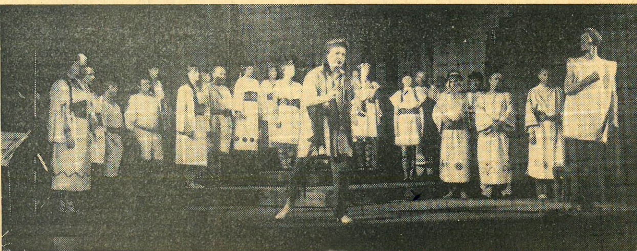
DS Krakonoš, Vysoké nad Jizerou: Nová komedie o Libuši a dívčí vojně v Čechách