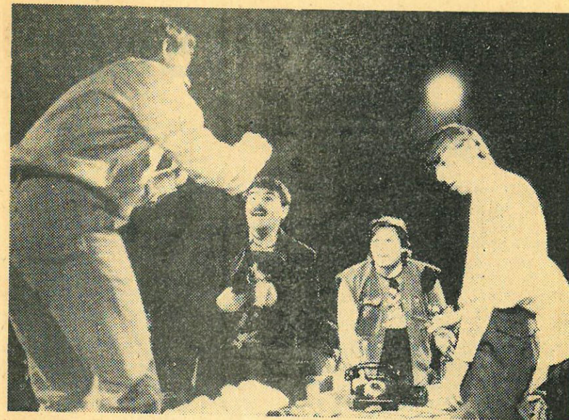
DS Havlíček, OB Vejprnice, Vasilij Šukšin: Energičtí lidé

DIVADELNÍ SOUBOR J. K. TYL PŘI ZV ROH MOSTNÍ OBVOD ČSD BRODEK U PREROVA VYSTOUPIL S GOGOLOVOU ŽENITBOU. Zvolil moderní překlad této klasické hry, jež předpokládá současný výklad situací a postav. V představení se však realizuje pouze příběh. Ačkoli režisér ponechává velký prostor herecům, témat jednotlivých postav nebylo využito a celkový záměr inscenace se poněkud vytratil, i když jde o poctivou snahu souboru inscenovat Gogolův text.