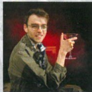
HAWKEYE PIERCE JAN RACLAVSKÝ