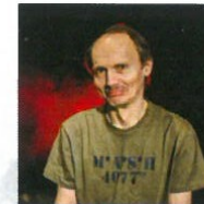
SVĚTLO/ZVUK PAVEL DOLEŽAL