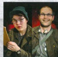
RADAR O'REILLY FILIP FAJT TIBOR BÍBEL