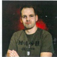
REŽIE MAREK ŠUDOMA