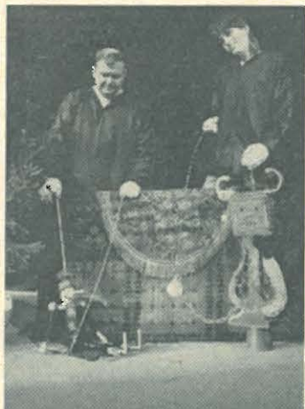
Loutkové divadlo „V boudě“ z Plzně hraje dnes inscenace „Don Šajn“ a „Poslechněte jak bývalo...“. Hry jsou inscenovány marionetami na drátě.