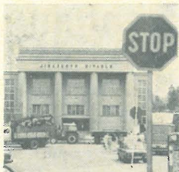
Skutečně jde jenom o dopravní značení...