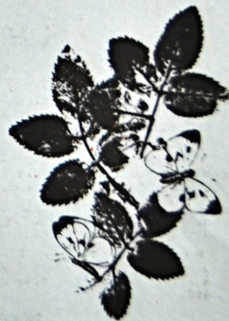
Graticky 1111 - M. Uhlíř

Osvobození města Sovětskou armádou a Vítězný únor 1948 znamená pro město nový hospo- dářský a kulturní rozvoj. Mě- sto se stává sídlem pletářské- ho průmyslu a důležitým prů- myslovým centrem jižních Čech. Je tradičně městem bohatého kulturního života, vyhledáva- ným místem rekreace a branou do oblasti Orlického jezera, Šumavy i celého jihočeského kraje.