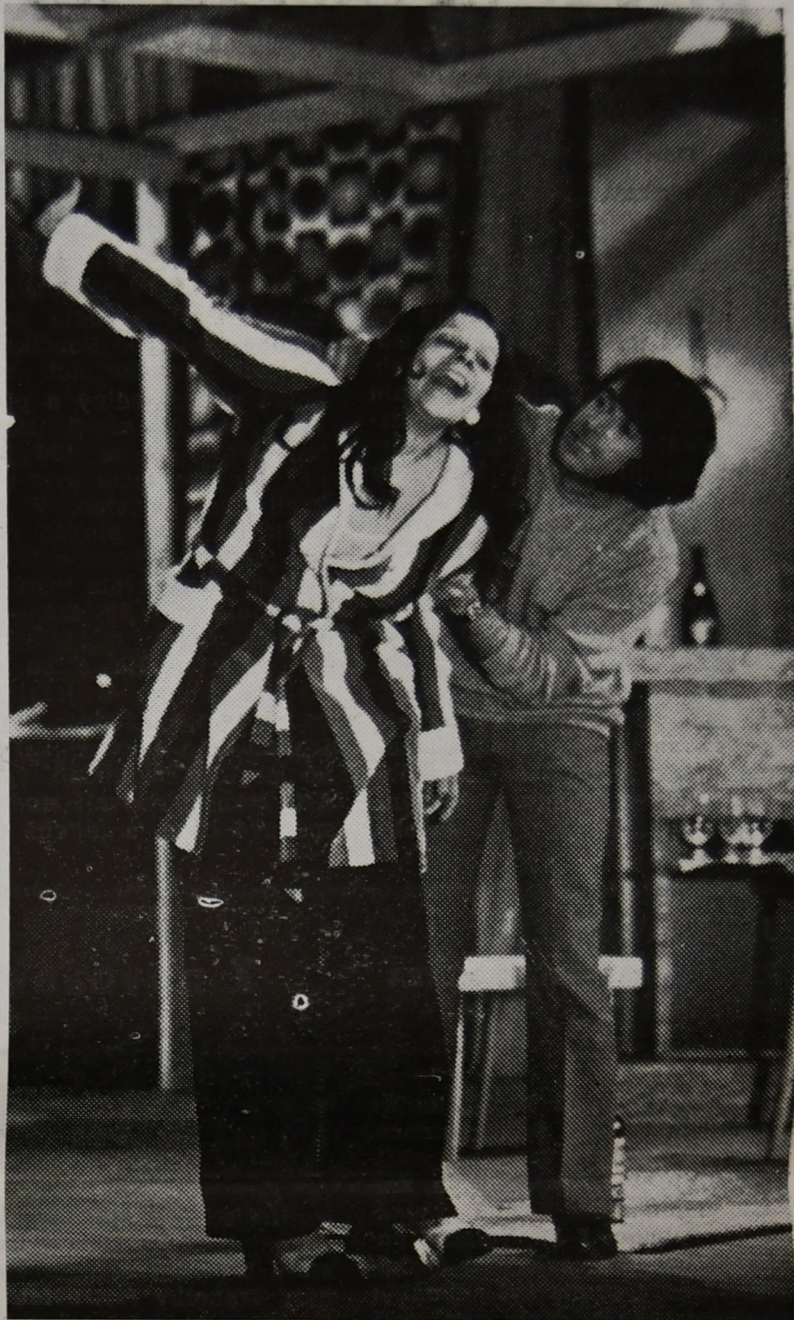
Tvorbu naší nejmladší generace zastupuje inscenace kterou, uvidíme ve středu 24. dubna - (Daň zraní).

ZPRAVODAJ ÚPICE 74, vydává organizační výbor festivalu „Úpice 74“. Odpovědný redaktor: M. Červínková, redaktor: E. Kulťová. — Vydáno se souhlasem odboru kultury ONV