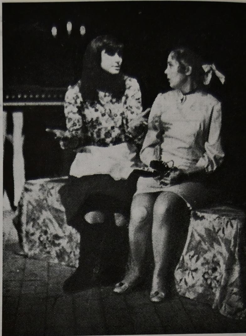
Inscenace Luigiho srdce od Ivana Bukovčana bude 26. 4. uzavírat celou úpickou přehlídku.